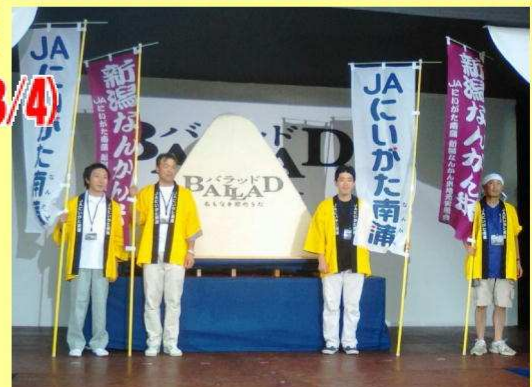
▲完成したジャンボおにぎり (記者発表のステージの上で)

JAIにいがた南蒲の青年部を中心とした4名が会場にて製作に協力。中之島のギネスブック認定級の巨大おにぎりは、映画の出演者はじめ、集まった人たちの驚きの的となりました。