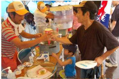
▼より取り見取りの「おまつり満腹広場」

「ますます元気いっぱい! 中之島」を合言葉に第14回中之島夏まつりが、中之島支所周辺で盛大に行われました。途中雨が降ったりと落ち着かない天候の中でしたが、約8,500人が来場し、中之島を愛する市民力で熱い夏まつりを創り上げ、大いに賑わいました。