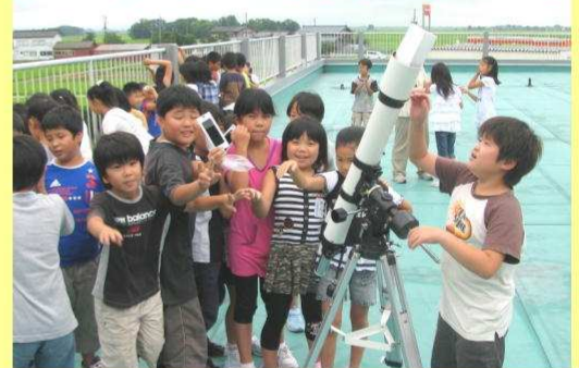
▲観察を楽しむ児童たち

46年ぶりに日本の陸地で皆既日食が見られたこの日、中之島中央小学校でも部分日食を観察。児童たちはこの壮大な天体の現象に驚き、熱心に観察していました。