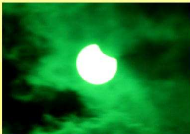
▲日食が始まる 10時16分 (遮光板を使用して撮影)