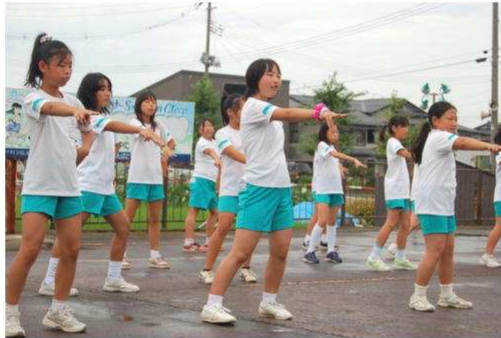
▲中之島中央小学校ダンスクラブのみなさんによる「トッキッキダンス」