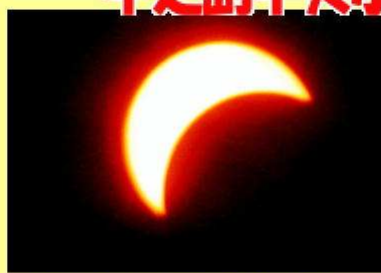
▲日食の最大のころ 10時46分 (遮光板を使用して撮影)

46年ぶりに日本の陸地で皆既日食が見られたこの日、中之島中央小学校でも部分日食を観察。児童たちはこの壮大な天体の現象に驚き、熱心に観察していました。