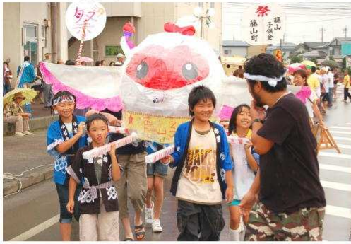
◀▼元気いっぱい!! 「子どもみこし」23基が参加しました。

「ますます元気いっぱい! 中之島」を合言葉に第14回中之島夏まつりが、中之島支所周辺で盛大に行われました。途中雨が降ったりと落ち着かない天候の中でしたが、約8,500人が来場し、中之島を愛する市民力で熱い夏まつりを創り上げ、大いに賑わいました。