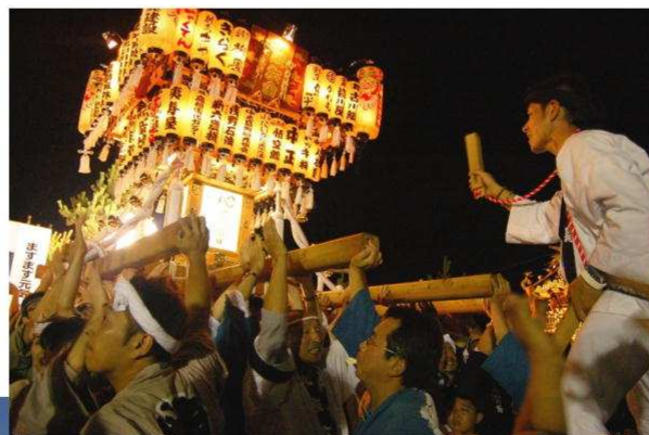
▲豪華! 華麗! 大迫力!!の「お神輿渡御」まつりの大トリを飾ってくれました。▶