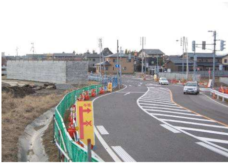
▲ 刈谷田川改修事業が進むにつれ移りゆく町並み(大橋付近)