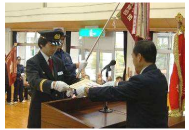
長岡市無火災表彰を受ける上通分団(写真左)と中条分団(写真右)。