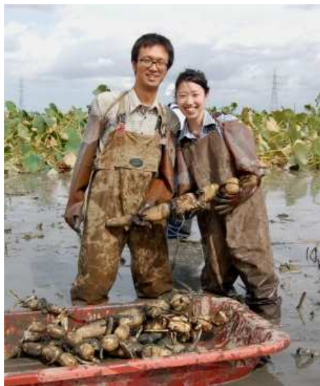
自分で収穫する喜びで、自然と笑顔がこぼれます。▲