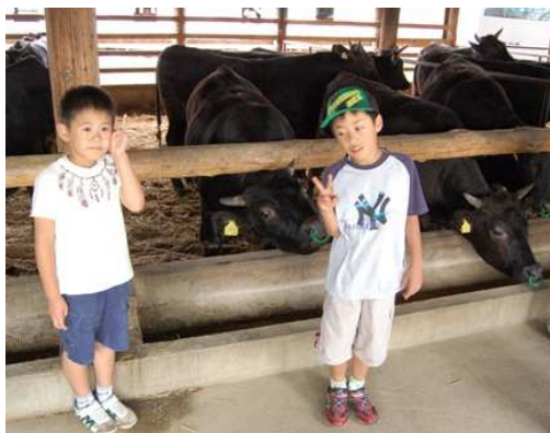
中之島牛生産農家の牛舎見学にて牛さんと記念撮影。すっかり牛さんに懐かれています。▲