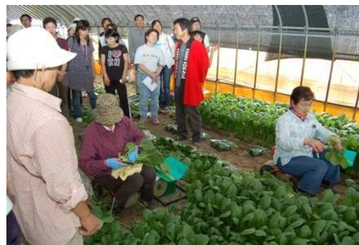
中之島の安心、安全の無農薬栽培の小松菜「こまつみどり」の栽培ハウスで、収穫現場を見学。▲