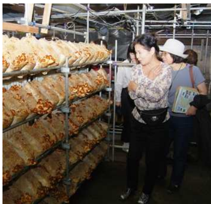
きのこ生産農家の見学では、「中之島のきのこって大きいがーねー。」との声がたくさんあがりました。▲

参加者からは、「来年もまた参加したい。」「食の安全を考えさせられて、非常に有意義だった。」との声が寄せられました。