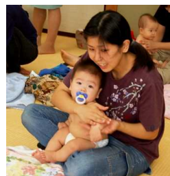
ベビーマッサージ講演会 (9月25日)