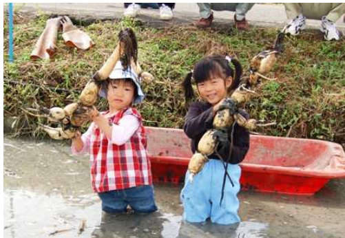
わたしたちも大きな「れんこん」採ったよ。▲