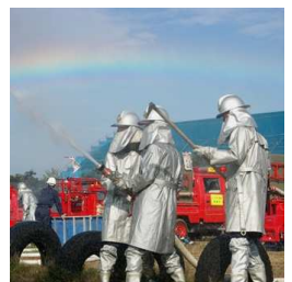
中之島消防団消防演習 (10月7日)