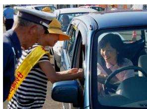
秋の交通安全指導所開設 (9月25日)