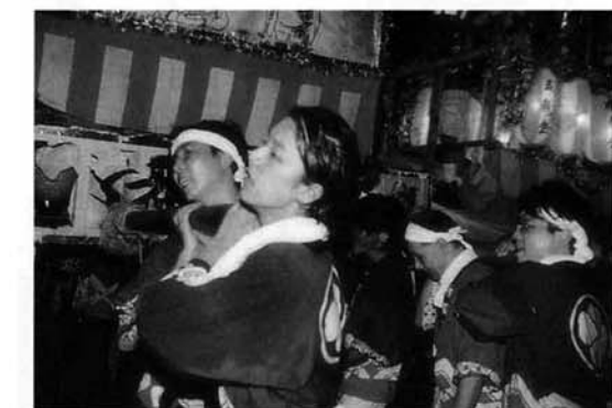
▲今年も勇壮な押し合いが繰り広げられました