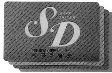
SD加盟店のステッカー

この制度は、一年以上無事故・無違反を継続している優良運転者が「SD(セーフドライバ)特典の店」(県内183業者、618店舗・事業所)で買い物や各種サービスを受けようとするときに、SDカード(交付日から1年以内のものに限る)と免許証を提示すると料金の割引等を受けられるというものです。SDカードは、同センターに「運転記録証明書」又は「無事故・無違反証明書」の交付申請をし、その証明日前1年以上無事故・無違反である場合に証明書に添えて交付されます。