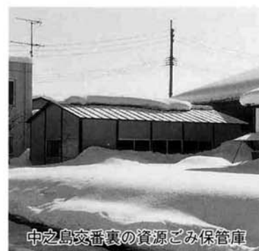
中之島交番裏の資源ごみ保管庫