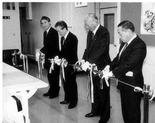
電算始動記念のテープカット

戸籍事務の電算化に伴い、個人情報(プライバシー)をしっかりと保護・管理することが求められます。町では、条例等に基づき、戸籍データの保護・管理について万全かつ厳正な取扱いをしていきますので、町民のみなさんのご理解をお願いいたします。