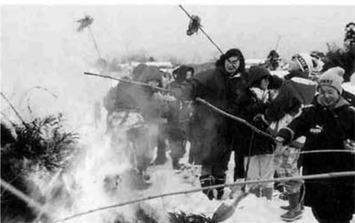
残り火でスルメを焼く人たち

健康と豊作を願って 小正月行事としての「さいの神」が、町内各地で行われました。 1月15日（木）、中野東地区でも子供会やJA青年部のみなさんが中心となって「さいの神」が立てられ、午後4時過ぎに点火されました。 厳寒の中ではありませんが、1年間の無病息災と豊作を祈りつつ、残り火でスルメを焼く多くのみなさんの姿がみられました。