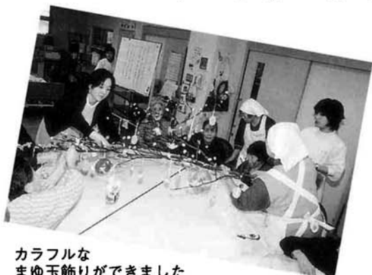
カラフルなまゆ玉飾りができました