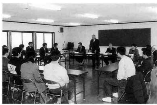
商工会の会議室で行われた「町政を聞く会」

く、和やかな雰囲気の中にも緊張感がみなぎり、激しいカルタの争奪戦が繰り広げられました。