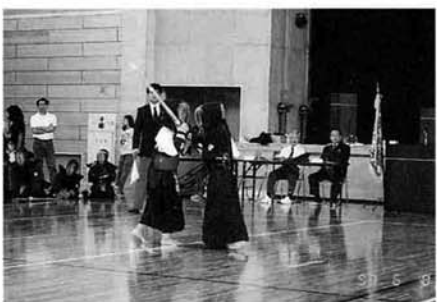
北体育館で熱戦が繰り広げられた剣道大会写真は小学生団体戦の1コマ