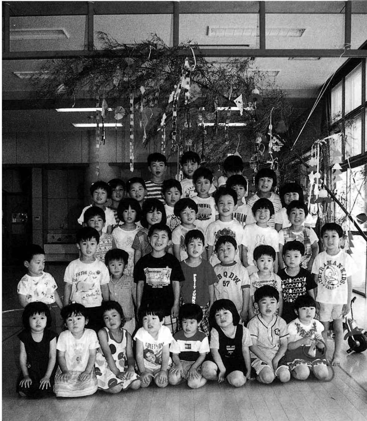
7月4日(金)、中条保育所にて