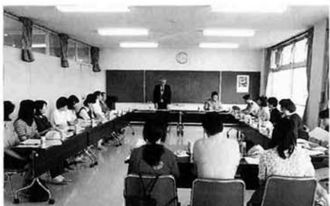
児童・生徒の母親のみならず20名からなる「交通安全母の会」の発足総会