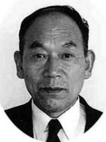
吉田 貢 議員