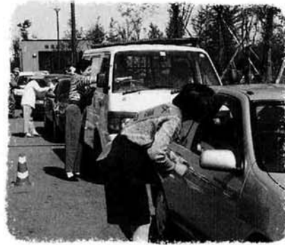
レンコン食べて安全運転を

安全運転をレイコウしよう 夕暮れは、早めのライト「反射材」をスローガンに、九月二十一日（木）から三十日（土）の十日間にわたり秋の全国交通安全運動が実施されました。その初日、見附市今町地区の国道8号線において交通指導所を開設し、「励行」をもじって「安全運転の「レンコン」を！」と、通過車両へのレンコンの配布を行いました。見附警察署・交通安全協会の協力のもと、町特産の大口径レンコンを手渡ししながらドライバーのみなさん一人一人に交通安全を呼びかけました。