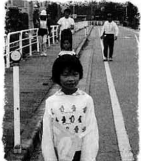
ウォークラリーから