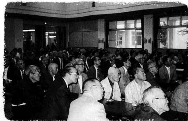
小学生の作文発表や婦人会による楽しい踊りの披露が

いつまでも お元気で 九月十五日(敬老の日)、町農村環境改善センターで中之島公民分館主催の敬老会が盛大に行われました。 当日は、約一七〇人の七十歳以上の方が出席、小学校の代表児童の作文発表や婦人会のみなさんによる踊り、カラオケなどで楽しいひとときを過ごされました。