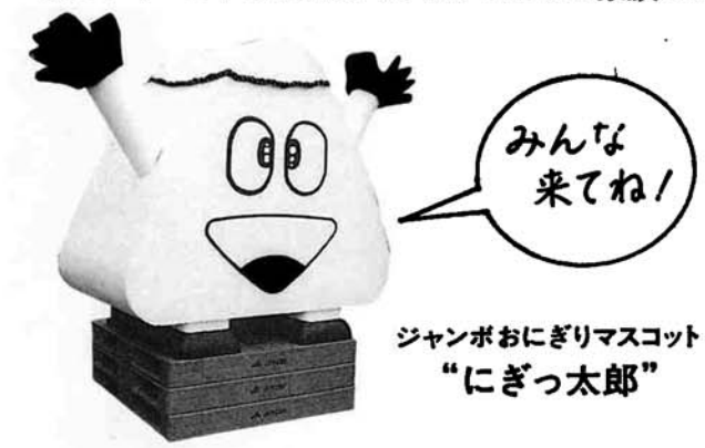
ジャンボおにぎりマスコット “にぎっ太郎”

※他にも、ちびっこ広場(メルヘンロードトレイン・ファファ)、農産物品評会・即売会、花いっぱい運動セール、「コロニー白岩の里」児童作品展・即売会、かかしコンテスト、各種模擬店など 楽しいイベントが盛りだくさん!ぜひ、ご家族みなでお出かけください。 ※日程は変更になる場合があります。