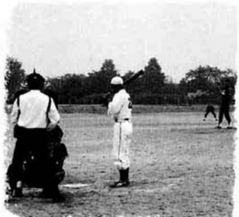
近郷親善野球大会から

ロウオークラリー&グラウンドゴルフ大会 * 期日 9月23日(秋分の日) * 会場 町民文化センター ◎ 優勝 ラビート(大竹ファミリー) ○ 準優勝 キンキキッズ(松井ファミリー) ▼ 第三位 さち&みは(内藤ファミリー) □ 第十四回近郷親善野球大会 * 期日 9月23日(秋分の日) * 会場 町野球場ほか ◎ 優勝 オークランド(与板町) ○ 準優勝 クロッカス(中之島町) ▼ 第三位 CAROL(与板町)、スワクラブA(三島町)