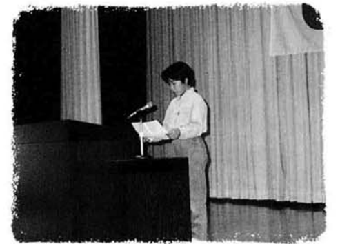
中之島公民分館敬老会