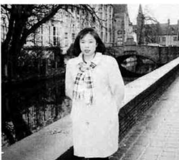
“橋の街”ブルージュにて

ブリュッセルは、さすがEC本部やNATO総司令部などの国際機関を置く国際都市だけあって、モダンな高層建築が立ち並んでいました。『世界で最も美しい広場』といわれるグランプラスには、華麗な王侯文化を思わせるバロックやゴシック様式の建物が広い石畳の広場の回りにずらりと並び、現代と中世の香りを残す建造物が違和感なく共存している魅力的な町でした。