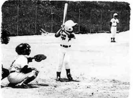
かっ飛ばせ! 中央小