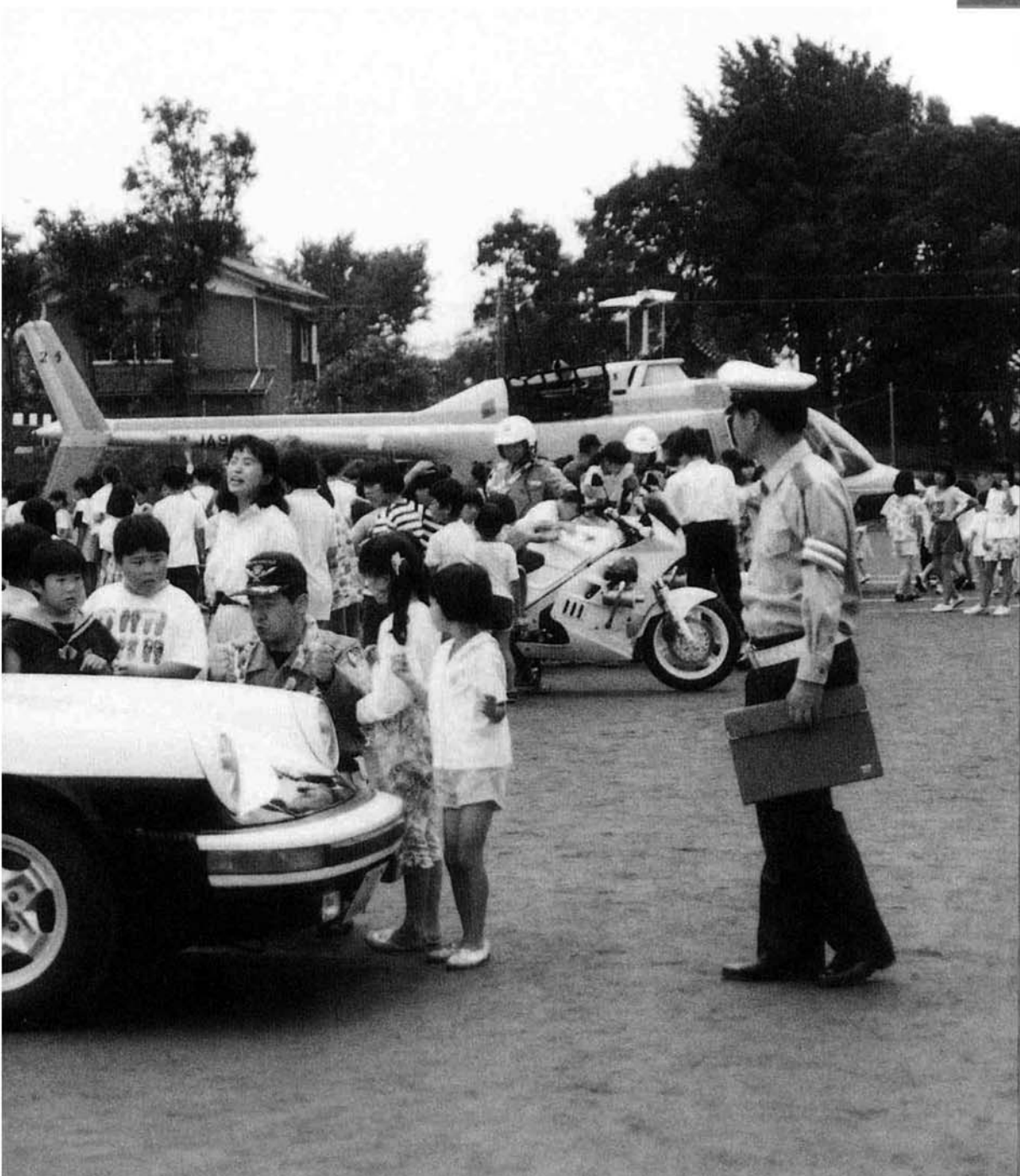
6月28日、信条小学校 町民総ぐるみ交通安全推進大会 交通安全教室から