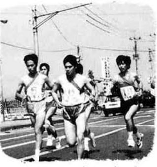
午前9時、一斉にスタート