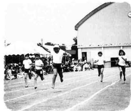
上っ子たちが、全力で戦い、演技しました