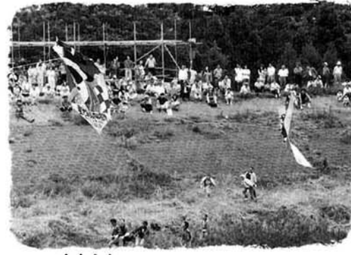
地がらめあり、空中戦ありの三日間