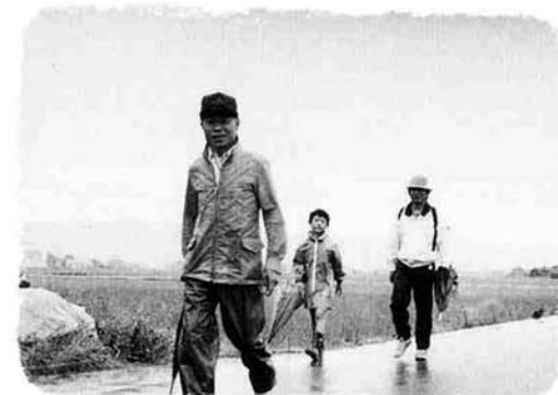
手にはカサ、雨具を着こんでさっそうと

雨の降る中 さっそうと 第十一回ふるさとを歩こう 一時、激しく雨の降りしきる中、「第十一回ふるさとを歩こう」が六月十九日(日)に行われました。役場を出発点とし、大竹邸記念館、杉之森薬師堂、サンバルコなかのしま、稲島稲荷神社、中之島中学校、中之島工業団地を経て役場に戻る約9kmのコースを、空き缶拾いをしながら歩くというこの町めぐりの行事に百三十人が参加しました。