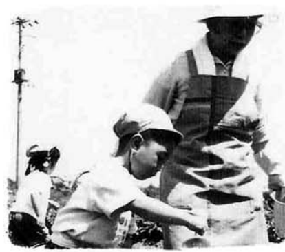
大きなさつまいもになりますように

信条保育所の子どもたちが、五百本のさつまいもの苗植えを六月二日(木)に行いました。特別保育「地域とのふれあい事業」の一環としてのものであり、祖父母の見守る中、子ども