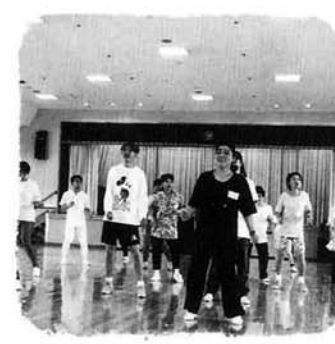
サンバルコは熱気ムンムン

軽快なリズムにのって レクダンスフェスティバル 町民のみならず、新井市や小千谷市など町内外から約七十名が参加し、六月二十六日(日)サンバルコなかのしまで「レクダンス(レクリエーションダンス)フェスティバル」が華やかに開催されました。ヒット曲にあわせた創作ダンスを通し、仲間との交流が一段と深められたことでしょう。