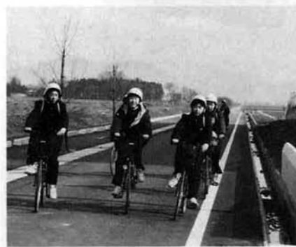
みんな一緒に自転車通学

理科室は、目的に応じて二つの教室に分けられているし、放送室にも今まで見たことがない機器が並んでいました。私は中学校生活最後の一年をこのようにすばらしい校舎ですこせるところを幸せに思います。 こんなすばらしい校舎を後輩達に引き継がせるためにも大事に扱っていききたいと思っています。