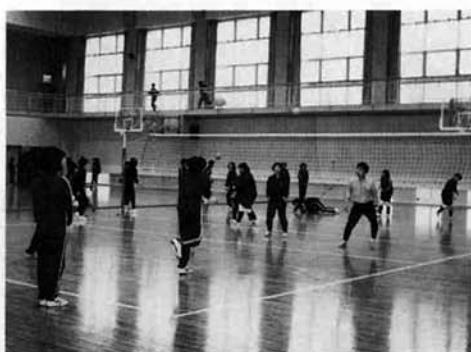
天井が高いから思いっきりできます。