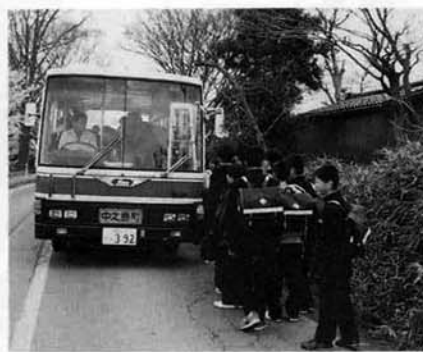
AM7:30 スクールバスで登校します。

この校舎をどう思うかと聞かれてすぐ答えられるのは施設が整っているということだと思います。