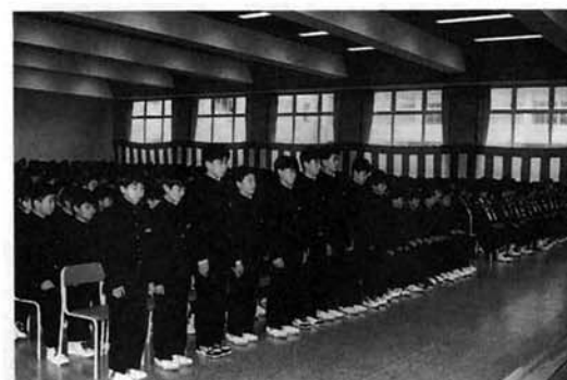
新入生の呼称でみんな緊張ぎみ。

ぼくは、入学式の日これからこの学校で勉強をするのかと思いましたが、中学校での勉強は、小学校ではなかった教科や一つの科目で使う教科書や資料が増え、小学校の時より大変になったと思います。だから人においていられないようにがんばりたいです。部活では、サッカーをがんばりたいです。勉強に部活に両立できる中学生になりたいです。