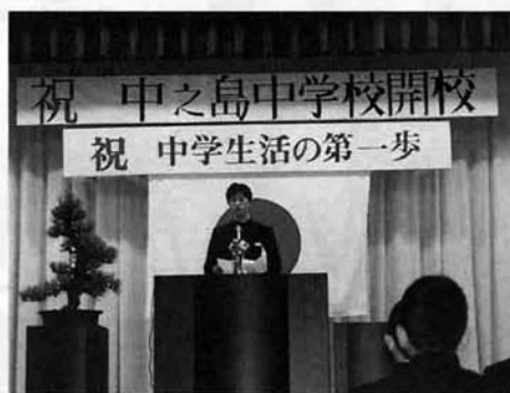
入学式の一コマから

学習や部活動、生徒会の活動等を嬉々として始めました。私たち教職員一同、開校の感謝を忘れず、心身ともに健やかな中学生、中之島の次代をになう若人の育成に、全力をつくしたいと考えます。どうぞよろしくご指導、ご鞭撻くださいますようお願い申し上げます。