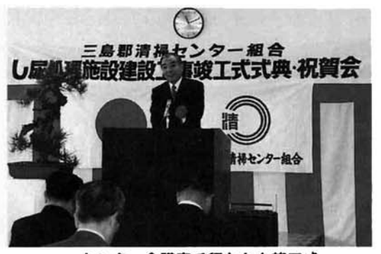
センター会議室で行われた竣工式

自動車税の納税期限は 6月1日 です。 お忘れなく納税しましょう。 自動車を下取り又は譲渡したときは名義変更手続を、車検切れの自動車をお持ちの方は、廃車の手続を早めに行いましょう。 新潟県三条財務事務所(電話0256-35-2209)