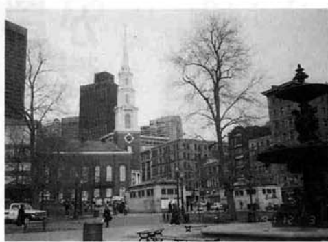
ポストンのダウンタウンにて

タウンタウンでは専門店が多くそれらが全体として調和のとれた一群を成しているのに感心させられ、歩道上に赤いライン等が引いてあり、これを辿ることで目的別に散策できる合理性も見事でした。また商品を買ってもきれいに包装してくれる店は