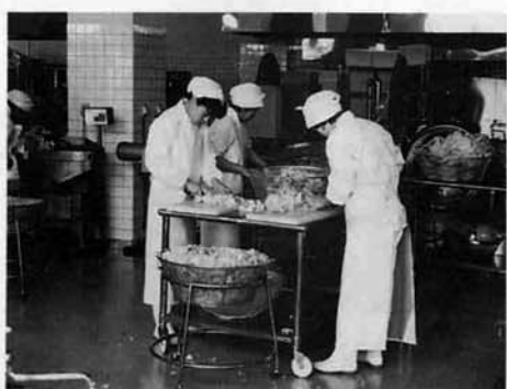
1350食、づくりがいがあります。

座っていいのかわからないようでした。ちなみにこの日のメニューは、みそラーメン風のソフトめんとアーモンドのごまがらめでした。