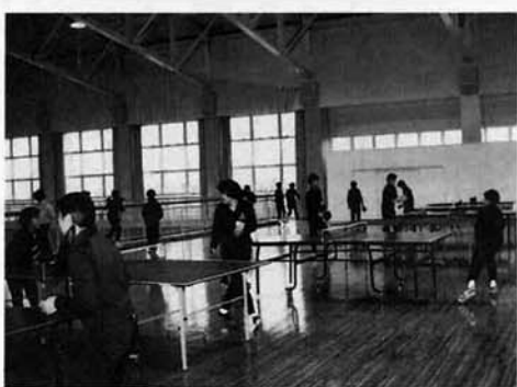
卓球は2階でやっています。