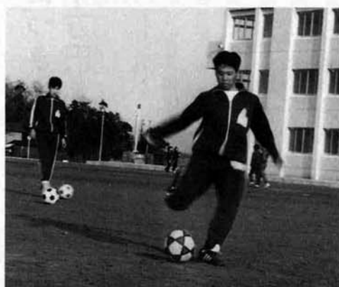
いい汗かいてますノナイスシュート!!