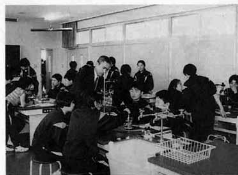
新しい理科室でさっそく実験