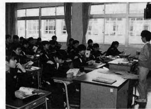
マジメ(?)な授業風景