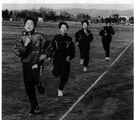
新しいグラウンドで思わず力もでます。