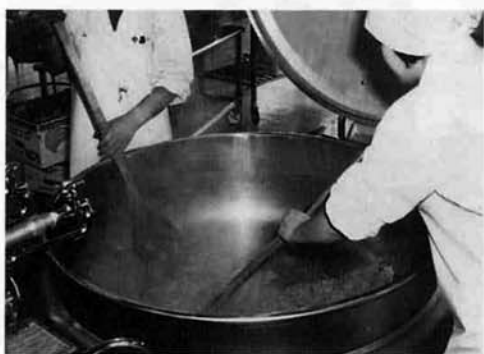
二人がかりでかきまぜます