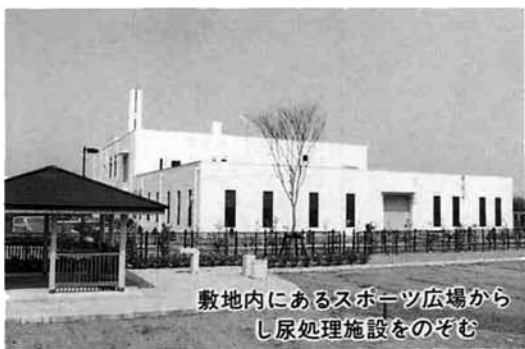
敷地内にあるスポーツ広場からし尿処理施設をのぞむ

完成が待たれた三島郡清掃センター組合のし尿処理施設が完成し、四月二十日に竣工式が行われました。 昨年二月に完成したゴミ処理施設と粗大ゴミ処理施設とあわせ、処理場建設計画は、すべて終了しました。 し尿処理施設は標準脱窒素処理方式の最新設備で、一般し尿処理と各家庭の浄化槽から収集する汚泥の処理を行います。処理能力は、一日五十キロリットル（し尿二十八キロリットル・浄化槽汚泥二十二キロリットル）