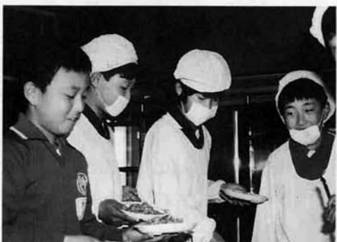
中央小の給食も順調です。

中央小への運搬も万全 小学校の給食は、共同調理場になつたため、運搬している間に冷めてしまうのではないかと思っている方も多いため、給食の保温には今まで以上に気を使っています。おみそ汁などをいれる食缶の保管庫は常に六十度に保たれ、そのまま熱いおみそ汁を入れ、運搬車も保温性の高いものを使用しているため、今までより温かい給食が出せるくらいです。また牛乳もビンから紙パックに代え、子どもが運ぶのに重くないよう配慮しています。子どもたちの間でもおいしいと評判も良好です。