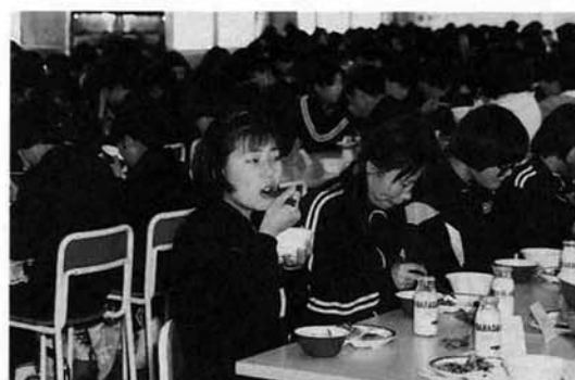
ウンノ味もナカナカ。

部活や勉強の方では、競争相手が増えて大変ですが、勉強も部活も両立させたいと思います。まだまだ新校舎に来たばかりで学校の中のこともしかしからないけど、残り二年間を楽しい学校生活にしたいと思っています。