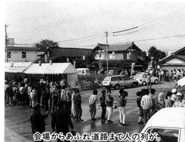
会場からあふれ道路まで人の列が。