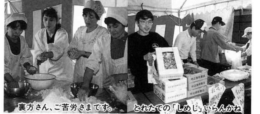
裏方さん、ご苦労さまです。