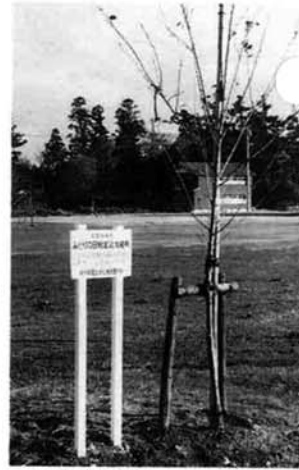
中野分館のさくらの木