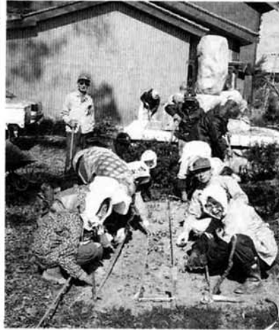
三沼分館での植付けの様子

また、30日には中野公民分館グラウンドにおいて地区住民の皆さんにより「みどりの日制定記念緑化推進事業」の補助によるさくらの木12本が植えられました。来年は、きれいに咲くといいですね。