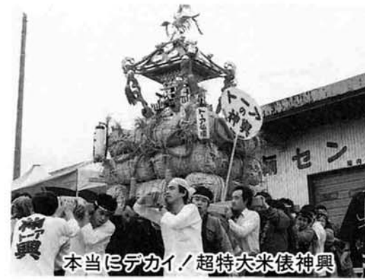
本当にデカイ！超特大米俵神輿