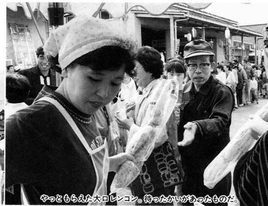
やっともらえた大口レンコン。待ったかいがあったものだ。

十月十五日、秋の収穫を祝う一大イベント「産業まつり コシヒカリとレンコンふれあい中之島」が開催され、多くの観客を集めました。 イベントの目玉は、なんといってもコシヒカリの新米十俵で作る「世界一のジャンボおにぎり」。(ギネスブック認定済) 高さ一・七メートル、幅二メートル、奥行き一・五メートルのジャンボおにぎりは完成後、一万個のおにぎりに作りなおされ来場者の皆さんへプレゼント。 また、もう一つの目玉である県内の生産量を誇る「大口レンコン千本無償配布」も、開催前から千人を超える長蛇の列となるほどの人気ぶり。 その他、特産物の抽選会、中之島牛バーベキューの試食会、ジャンケン大会や腕相撲大会等数多くの催しが開催され、一万五千人もの観客の皆さんは中之島の収穫の秋を満喫していました。