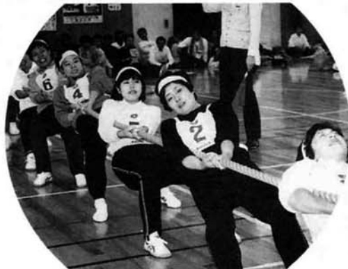
女子綱引き優勝の横野チーム