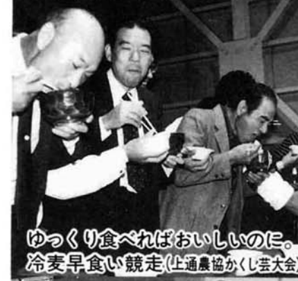
ゆっくり食べればおいしいのに。冷麦早食い競走(上通農協かかし芸大会)