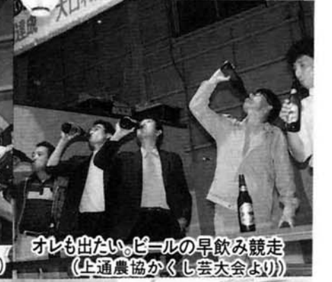
オレも出たい。ビールの早飲み競走(上通農協かかし芸大会より)