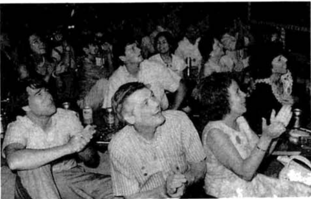
▲「長岡の花火は世界一だ」…花火が打ち上がるたびに大歓声があき起こっていました