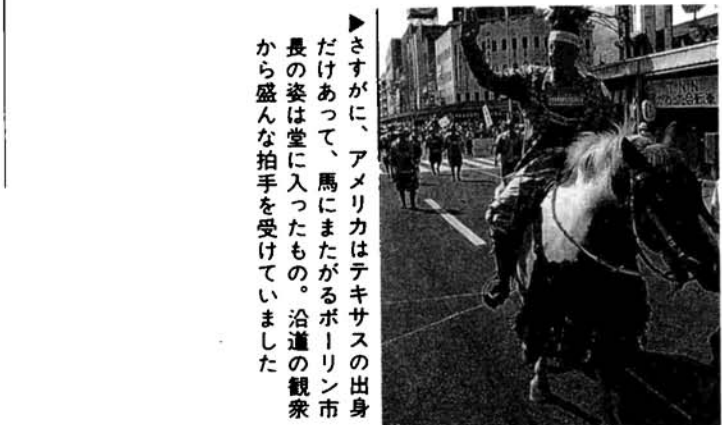
▲さすがに、アメリカはテキサスの出身だけあって、馬にまたがるボーリン市長の姿は堂に入ったもの。沿道の観衆から盛んな拍手を受けていました