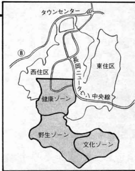
◀長岡ニュータウン中央地区

長岡市に建設される日本海側では初めてという国営公園の、基本構想案が発表されました。これにもとづいて建設省北陸地方建設局は、来年度の子算要求をすることにしています。