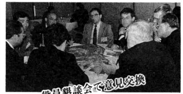
役員懇談会で意見交換