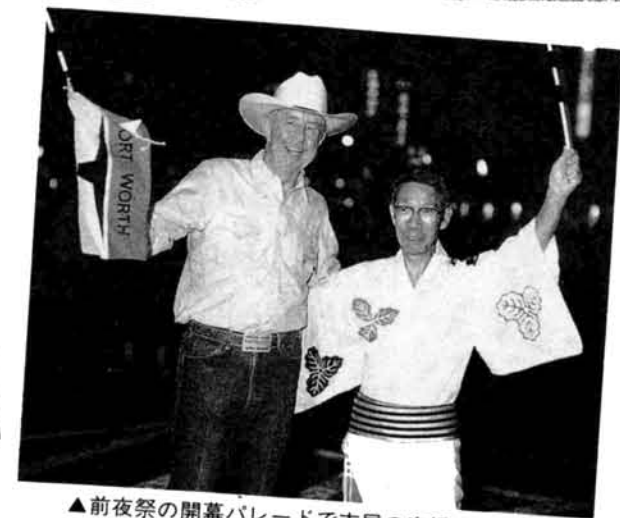
▲前夜祭の開幕パレードで市民の声援にこたえる日浦市長とポーリン市長