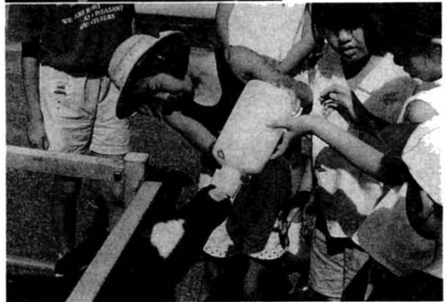
▲動く市政教室にて