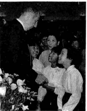
▲屈託のない笑顔でボーリン市長に話しかける子供たち