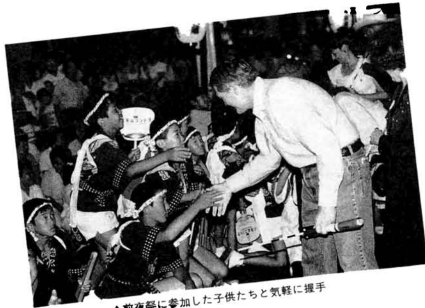
▲前夜祭に参加した子供たちと気軽に握手