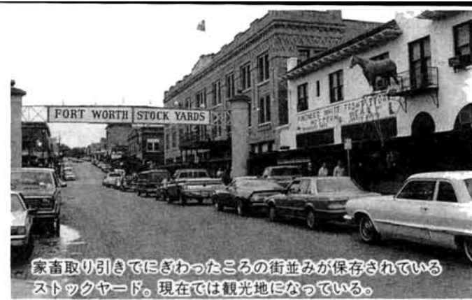
家畜取引引きでにぎわったころの街並みが保存されているストックヤード。現在では観光地になっている。