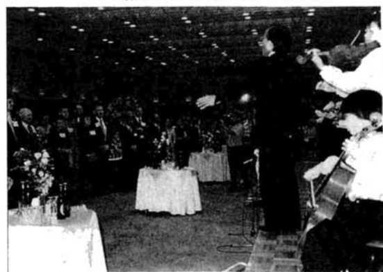
▼パーティーでは子供たちの弦楽合奏などで歓迎ムードを盛り上げました