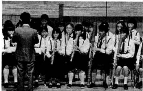
阪之上小学校器楽部 (全日本リコーダーコンテスト金賞)

10月9日(日) 午後2時開演 19人のコーラス、ミュージカル「サウンド・オブ・ミュージック」に挑戦、 第1部 掃って来た歌 第2部 音楽の楽しみ 第3部 サウンドオブミュージック (ピアノとお話し) 合唱 コロ・アルモニコ、みづばコーラス、みゆきコーラス、さつき、長岡少年少女合唱団、ばいばい樹、長岡市民合唱団