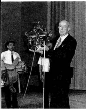
▲記念に、長岡からはみこしのミニチュア、フォートワースからは馬のくらが、お互いに贈られました（記念式典で）