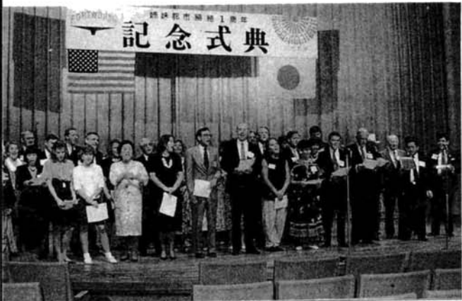
▲「ナガオカ市とフォートワース市は皆トモダチ」と、替え歌を合唱する代表団のみなさん

翌日三日午前中、一行は滞在中に出会った様々な人との思い出を胸に、掃路につきました。ホームで見送る市民の皆さんと肩を抱き合せて別れを惜しむ様子に、この交流が確かな実を結んできていることが感じられました。