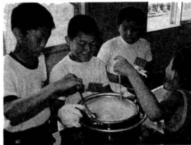
▼カルピスづくり(サマースクール)

政教室。ことしは特に戊辰史跡探訪コースが好評ですが、こどもたちにとっては、なんといっても親子コースの牧場訪問が一番の人気です。夏休み中だけでも五回、牧場を訪れました。