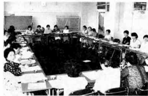
▲11月1日のつどいに向けて初会合

程、市内四十二の婦人団体、グループの代表による実行委員会が発足しました。つどいの期日は十一月一日。長岡初の女性のつどいを女性自らの手で成功させようと頑張っています。