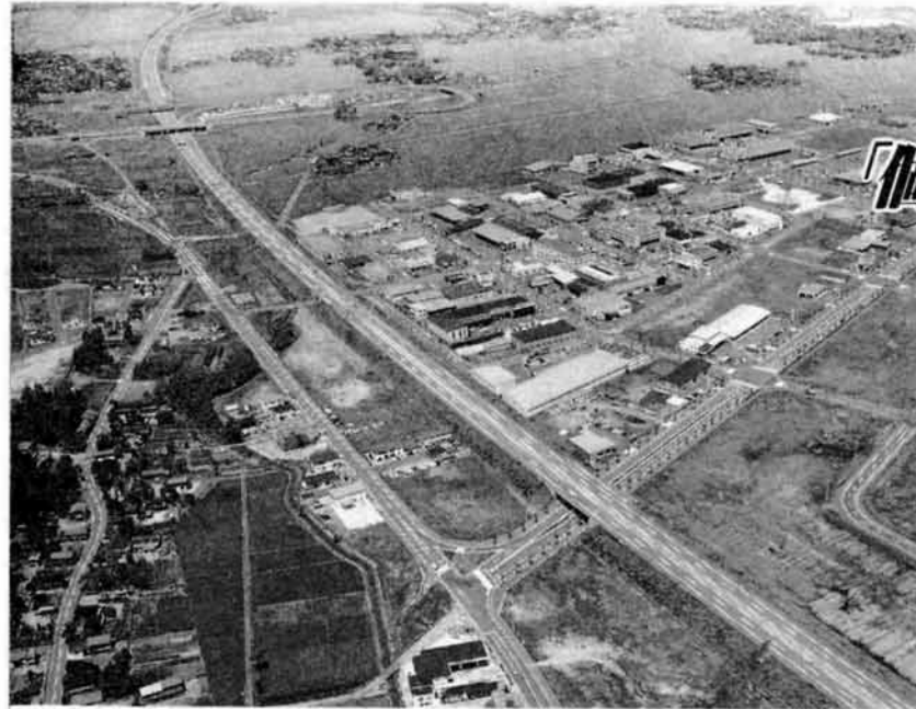
▲長岡インターチェンジに隣接する絶対条件の新産業センター。現在140社2,100人が働く一大流通センターです。