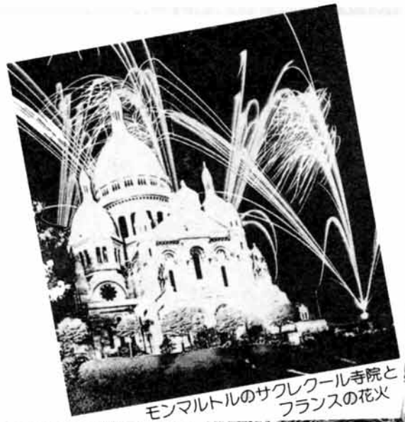
モンマルトルのサクレクール寺院とフランスの花火