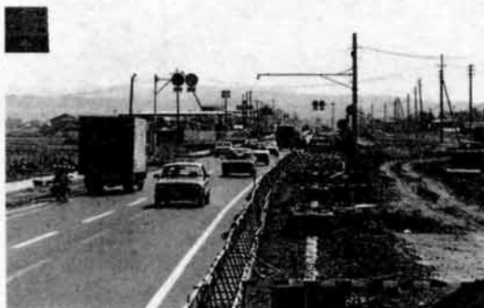
▲工事が進む長岡バイパス(堺町付近)

長岡大橋も四車線化に向け拡幅工事が始まっていますが、完成までには数年かかる予定です。 長岡バイパスと長岡東バイパスは昨年十一月に接続し、ますますその重要性が高まっています。建設省では東バイパスについても小曾根交差点の立体化工事にとりかかるなど、四車線化に向け整備を進めています。