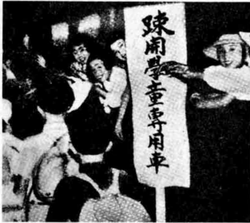
戦争中は子供たちも親もとを離れて疎開。