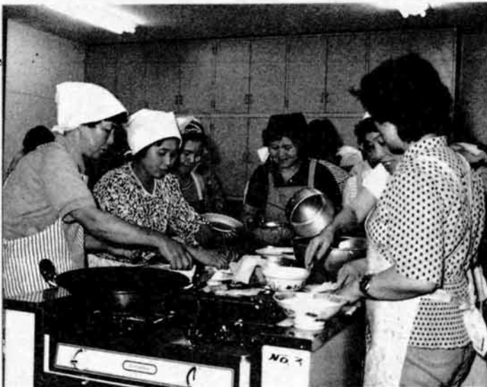
▲健康づくり推進委員が中心となって、毎月開かれている料理教室(下川西)

先月十四日と二十一日、消防団各方面隊の春季消防演習が長岡工業高校・福戸小学校グラウンドなど五会場で開催されました。 これは、約千六百人いる消防団員が日ごろの消防訓練の成果を出し合っており、一層の技術の向上を目指すものです。 集まった市民の見守る中、消防団員が号令に従いきびきびとした動作で、小型ポンプ操法や放水訓練などに真剣に取り組んでいました。