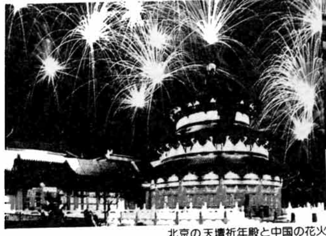
北京の天壇祈年殿と中国の花火

今年は大手大橋にも ナイアガラがブリトモ 大花火大会の呼び物・ナイアガラ大スターマインが今年は大手大橋にも仕掛けられます。