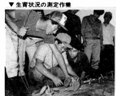
▼生育状況の測定作業