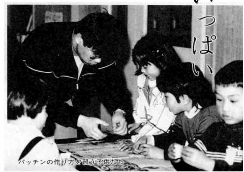
バッチンの作り方を習う子供たち

学校が引けると、こども館にはぞくぞくと子供たちが集まってきました。関原連絡所に併設した児童館では、もう顔なじみも増えました。思い思いに本を読んだり、チェスや将棋をしたり、二階に駆け上がると、竹馬やフロアプレイトで遊べるホールもあります。「いろんな学年の子と一緒に楽しく遊べるように、きまわりを作ったり行事を計画してみよう」とさきころは、子供会議も開かれました。子供たちの手助けをする二名の指導員は、ガキ大将たちに囲まれて、手を焼きながらも張り切っています。