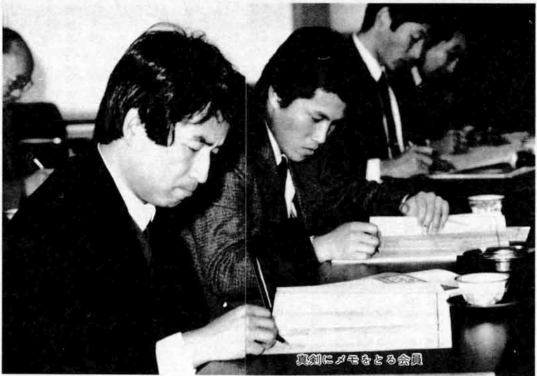
真剣にメモをとる会員

静かに鉄の部品を運ぶ搬送車が動いています。これは倉庫の棚から部品を工作機械のところまで運んでいるのです。工作機械は、必要な工具を選択して指定された所に穴をあけたり、削っています。そして、でき上がった部品は再び搬送車で倉庫に戻されています。これらの作業は、すべてコンピュータの指令で動き、この指令を伝えているのは光ファイバーです。これが産業用ロボットを使ったシステムなのです。今、一つ一つの機械に熱い視線をそそぎ、工場長の説明を聞いているのは、(財)長岡テクノポリス開発機構が主催するハイテックセミナーの「産業用ロボット利用部会」の皆さん。今日は、月例勉強会で、新潟市の(株)新潟鉄工所大形工場に現地見学に来ています。