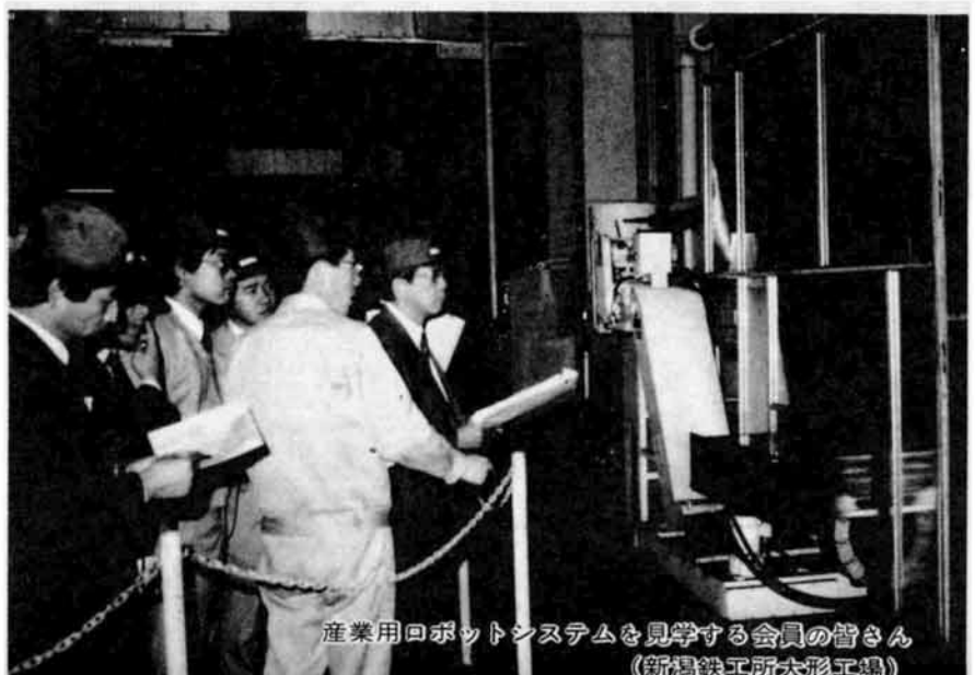
産業用ロボットシステムを見学する会員の皆さん (新潟鉄工所大形工場)