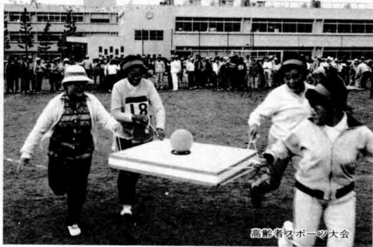
高齢者スポーツ大会

★第12回高齢者スポーツ大会 日時 5月20日(日) 午前10時～午後3時(雨天中止) 会場 阪之上小学校 対象 市内にお住いか通勤の方 クラス 一般男子(参加料700円) 一般女子(500円) 高校男子・女子(300円) 中学男子(200円) 1校6チーム以内) 中学女子(200円) 1校5チーム以内) 申込み 6月8日(金)までに参加料を添えて