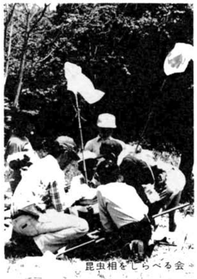
昆虫相をしらべる会

★ 地層をしらべる会 日時 5月20日(日) 午前9時30分～午後4時(雨天中止) 観望地 大積町黒川支流 集合 宮本東方バス停午前9時30分