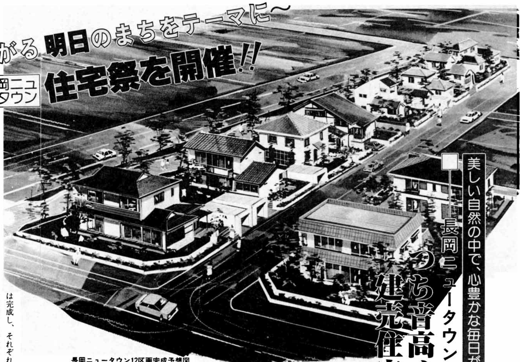
長岡ニュータウン12区画完成予想図