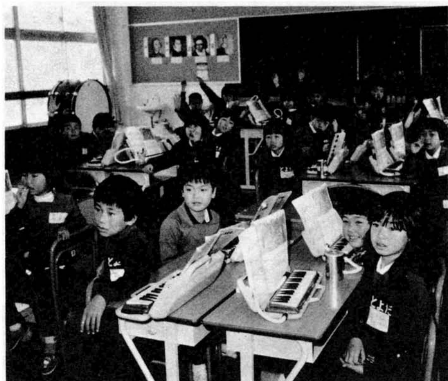
子供たちがのびのびと勉強できる環境を……(豊田小学校)

継続で建設を進めてきた、崎東小学校と大島小学校の校舎を完成させるほか、川崎東小学校は、屋内体育館も建設します。 さらに、児童数の増加している上川西小学校には校舎を、黒条小学校には体育館を、それぞれ増築します。