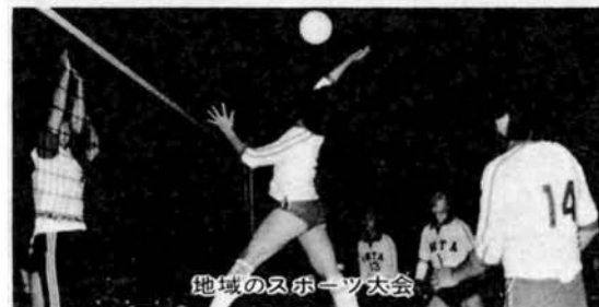
地域のスポーツ大会

◆ スポーツ・レクリエーション活動の振興 市民体育祭十九種目、地域スポーツ教室七十四、地域力づくり大会三十七地区、種目別スポーツ教室など、スポーツ・レクリエーション行事を数多く催します。また、学校の体育館やプールなどを開放して、スポーツと地域レクリエーションの振興を図ります。