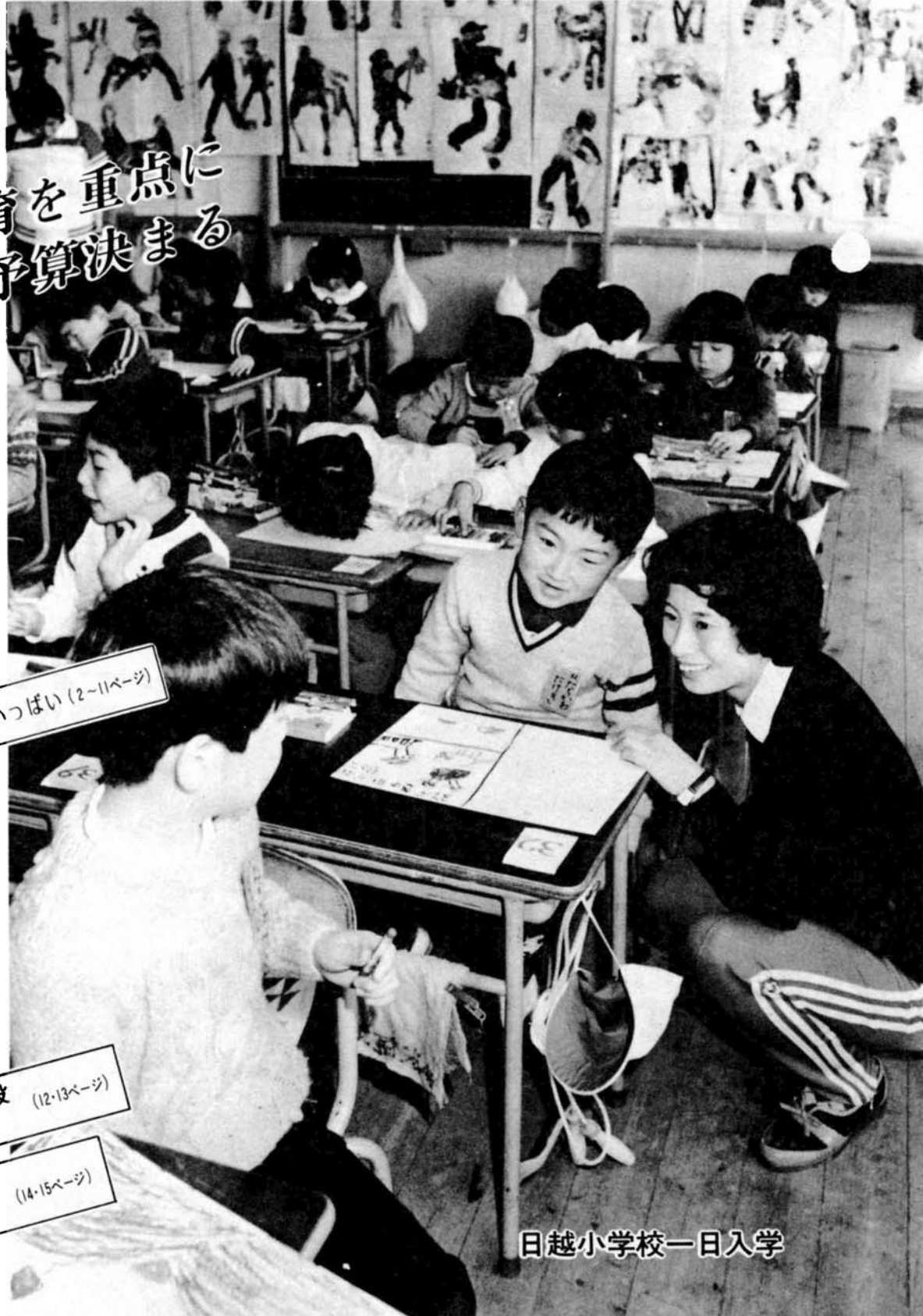
日越小学校一日入学