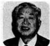
前田 丁目 耕 小

私たちの知識や経験が、再びいろいろなかたちで役立てられ社会参加ができますので、楽しい生きがいのある老後が送れると思います。 働くことは、心の張りにもなりますから、健康を保つためにもよいでしょうね。 シルバー人材センターを大いに期待しています。