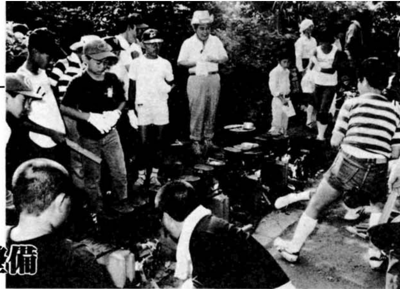
キャンプ場に炊事場やテーブルベンチなどを充実させます。