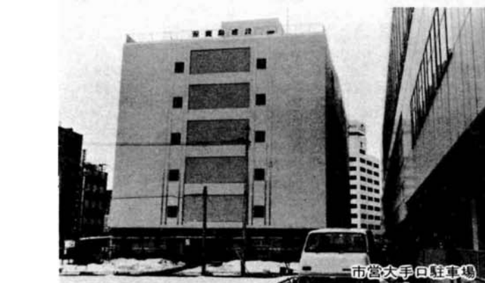
市営大手口駐車場

長岡駅前広場の整備は、大手口、東口とも引き続き積極的に進めます。大手口広場は、五十七年度中の契約により、秋には全部の建物の移転を完了します。