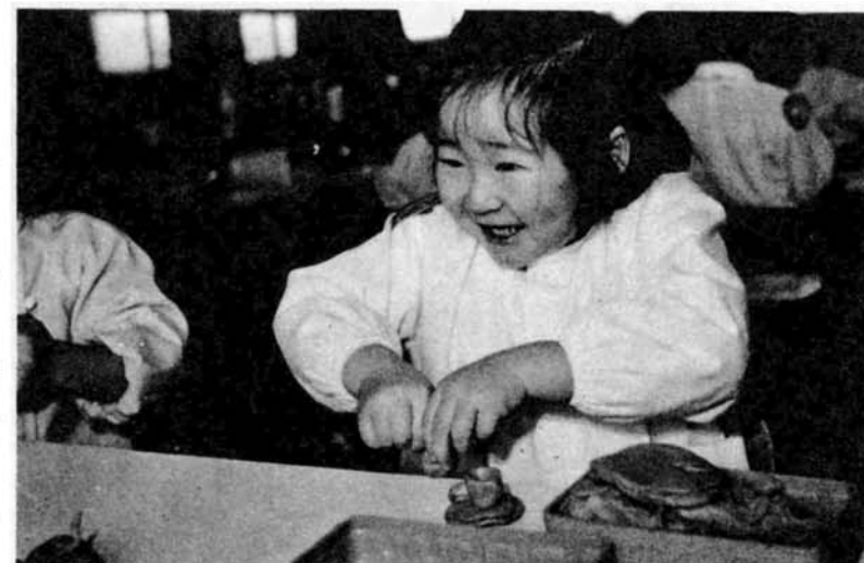
▼お父さんにあげるコーヒーカップかな？