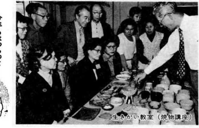
生きがい教室(焼物講座)

★ 和服の知識と着こな し方 日時 3月22日(火) 午後1時 30分～3時30分 会場 中越婦人会館 講師 北信越京都市も学院 山口サナイキ 定員 40人