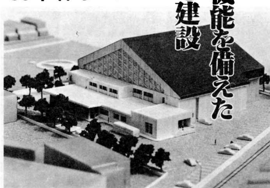
北部体育館の完成模型