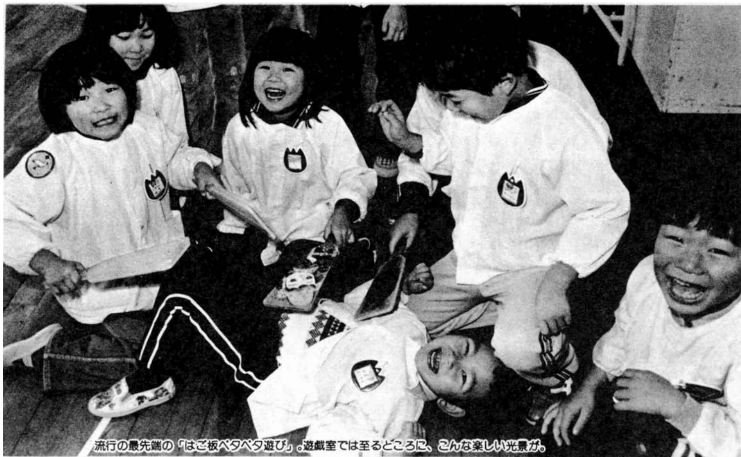
流行の最先端の「はご板ベタベタ遊び」。遊戯室では至るところに、こんな楽しい光景が。