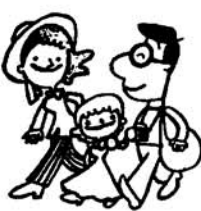
お出かけの前に 投票を!

◎投票日に花火の打ちあげ 皆さんからこぞって投票にお出かけいただくよう、投票日の午前七時に、投票が開始されたことをお知らせする花火を打ちあげます。