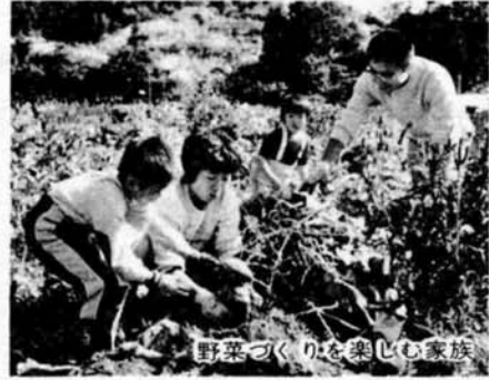
野菜づくりを楽しむ家族