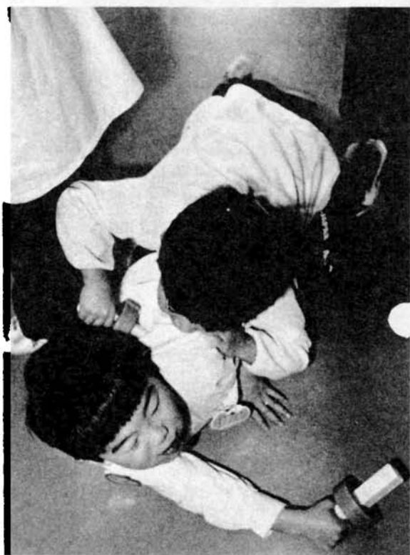
▶やったな、負けるもんかーこれも友情をはくむスキンシップ。

もうすぐ春です。新しく保育所や幼稚園へ通うお子さんのいるご家庭では、誰もが希望に胸がはずむとともに、ちょっぴり不安もあるのでは…。初めての集団生活ですから、本人にとっても親にとっても、何かと心配ですね。 でも、ご心配なく。初めのうちは、保育所に慣れずにおどおどしている子供たちも、やがて、素晴らしい笑顔で仲間と遊びまわることになります。 ご覧の写真は、宮内保育所の先輩わんぱく坊やたち。年長組の彼らは、小学校へ行く日を楽しみしながら、残り少ない保育所での生活を、底抜けに明るくすごしています。