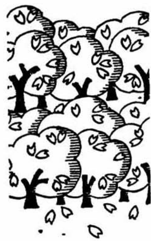
投票をすましてからお花見を

不在者投票の期限 四月二十二日(出)まで 時間：土曜・日曜に關係なく毎日午前八時三十分から午後五時まで ※ただし県議会議員補欠選挙