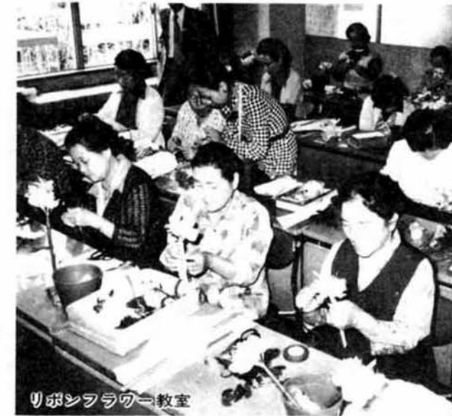
リボンフラワー教室