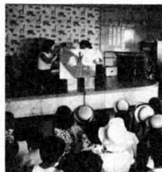
木の芽保育所トキちゃんクラブ

春先は空気が乾燥するため例年この時期は、「入山者の火の不始末」や「たき火」による火災が多く、これが年間火災発生件数の二割にも達しています。 暖かくなると野山に出かける機会が多くなりますが、タバコの投げ捨ては慎みまじょう。 また、大掃除の後などで、たき火をするときは、周囲の状況や風の強さに注意すると共に消火用具の準備もお忘れなく。