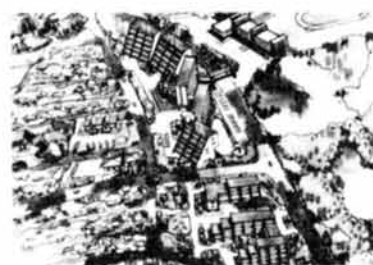
▲タウンセンター 完成予想図