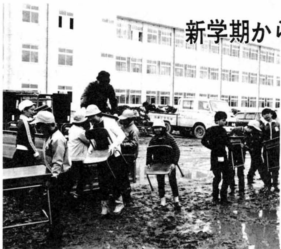
▲子どもたちは新しい学校の完成に大喜び—。春休みの一日、元気に机やいすを選び込むお手伝いをしました。