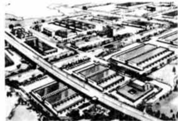
▲新産業センター 完成予想図