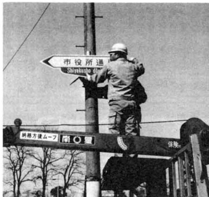
編集・発行/長岡市広報課(電話代表35-1122)昭和53年4月1日

長岡市は昨年、皆さんから親しみやすい道路の愛称を広く募集し、15路線に愛称を決めました。市では、さらにこの愛称を「市街地の道しるべ」として活用いただくため、名称を表わしたスマートな標識を、雪消えを待って一斉に取り付けました。 道路の両側に150メートルの間隔で取り付け、目に止まりやすくなっています。毎日の生活の中に愛称をご利用ください。