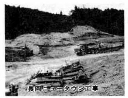
長岡ニュータウン工事

長岡の街づくりは日本のモデル そこで、市民の皆さんに提言したいのである。 長岡ニュータウンを中心とした街づくりが、日本におけるモデル的な街づくりであるという自覚を、市民の皆さん