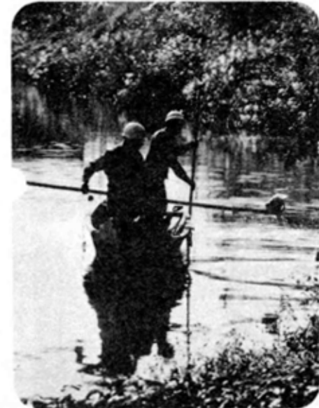
ごみの清掃にあたる「かもめ号」

進む 柿川浄化事業 ちょうどこの近くで、いま河川の工事が行われています。これは、長岡土木事務所が行っている柿川浄化事業で、金小橋から甲門橋までの間のへ