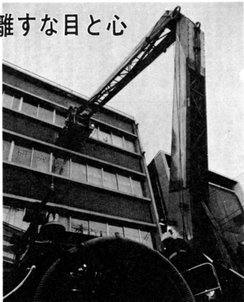
編集・発行／長岡市広報課 (電話代表35-1122) 昭和52年11月1日

「使う火を消すまで離すな目と心」——これはこの秋の全国火災予防運動の標語です。1人1人が、日ごろから火に注意し、尊い命や大切な財産を守りましょう。