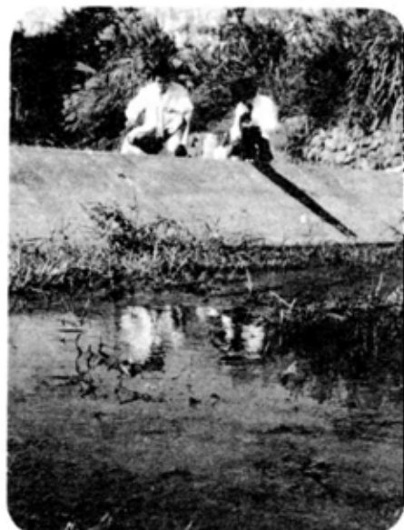
水のごれをチェック

ガスの使用は正しく安全に 今月は「ガス安全使用強調月間」です。北陸ガスでは、ガスを正しく使っていたら、ガスについてのご相談に応じておられます。また、ガスもれに気づいたら北陸ガス(☎33-1333)に連絡ください。