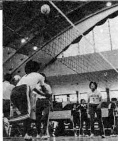
▶美容?と健康に、ママさんも大ハッスル。(ママさんバレーボール大会)