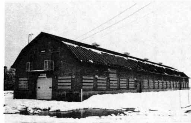
■ 市営牧場 昨年から3か年計画で進めているもので、ことしは子牛100頭収容できる1棟目の家畜避難舎が完成。牧草地の造成も進み来年からは放牧が始まる予定です。 49年度分事業費 1億1,389万5千円