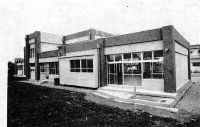
■ 中買保育所 世帯数の増加の目立つ栖吉地区にお目見えしました。保育所の定員は120名。保育所は元気の歌声が響いています。昭和49年6月1日完成 総事業費 7,100万9千円