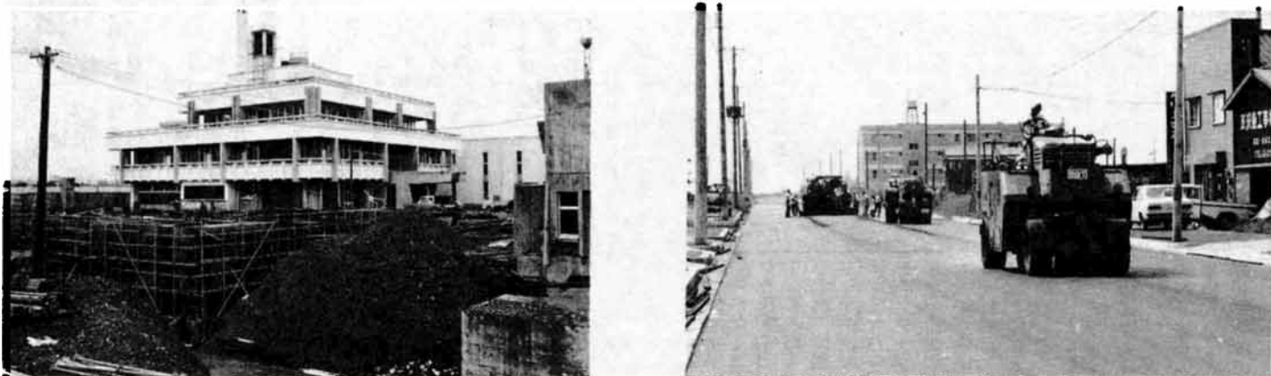
■ 下水処理場 昨年から3か年事業で進めているもので、位置は寿3丁目、面積は5万4千m 2 です。脱臭・浄化力ともに抜群の最新型。51年の春には待望の完成を見ます。 49年度分事業費 5億4,849万7千円