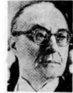
指揮者 A.B. スベシニコフ

ボルガの静けさ アムール河の激しさ ソ連国立アカデミー・ロシア合唱団は、昭和三十七年と四十三年の二回来日し、日本の音楽ファンに血を大いに湧かせた合唱団です。合唱団は総勢百人。指揮者のスベシニコフ教授は、ロシア民謡の權威で、著名な合唱の指揮者であり、編曲者であるばかりでなく、音楽の世界的最高学府であるチャイコフスキー記念モスクワ音楽院の院長でもあります。 この合唱団の設立は一九四二年(昭和十七年)ですが、当時は独ソ戦争(第二次世界大戦)が、いよいよ長期戦にはいろうとしており、ソ連が侵入し、苦難な戦いに直面していた時に、ロシア民謡で、その心を少しでも力づけようと、全国からすぐれた歌手を集めて編成されました。 レパートリーは、ロシア民謡だけでなく、バッハ、ラベルの古典から新しい作品におよぶ、幅広いです。 悠然と流れる大河ボルガの静けさと、雷どけの水で怒濤のように流れるアムール河の激しさの両面をたくみに生かしながら、聴く人の心の奥まで深くはいりこんでいく叙情、あるいはその心を強くゆさぶってやまない激情の連続は、まさに、声の交響楽の名にふさわしいものがあります。 この合唱団の大きな魅力に、バス(低音)の厚みがあります。日本に西洋音楽が渡来して以来、私たちはドイツ合唱の影響を強く受けてきましたが、ロシア合唱団の特色は、バスをうんと厚くし、その響きの上に各パートをピラミッド型に重ねていくことにあります。 合唱団に、三名のコントラ・バスがおりますが、指揮者のスベシニコフ教授は、コントラ・バスを発掘するに「砂の中からダイヤモンドを探すよりもたいへんだ」といっており、この三名のバス歌手もふだんの会話の声からして最低音を出しているのです。 したがって、この合唱団の響きはいかに厚く、この合唱団の響きを思いやるように美しいのです。