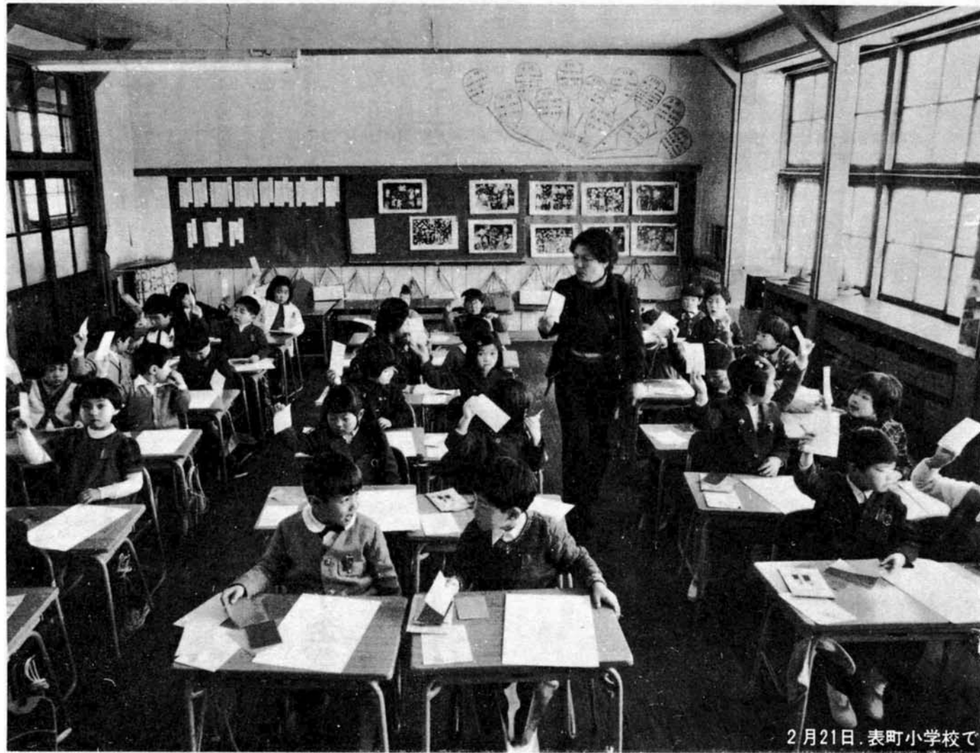
2月21日、表町小学校で