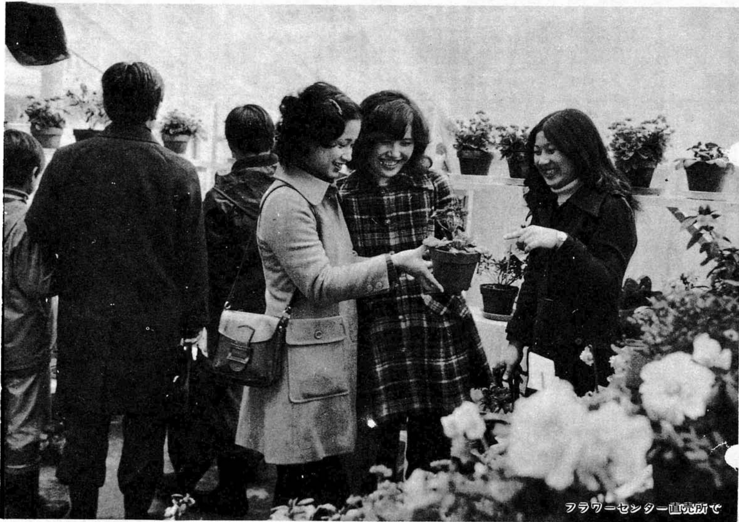
フラワーセンター直売所で