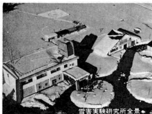
雪害実験研究所全景

雪を克服し明るいまちづくりを進めようと、長岡市ではことしも除雪機動隊を編成一、万全の体制を整えて道路除雪にあたっています。また昨年オープンした長岡市営スキー場も、たくさんの市民のみならずから利用され、明るいまちづくりに大きな役割をはたしています。しかし、このような積極的な、“雪の対策”とあわせて、基礎的な地道な雪害対策の研究も忘れてはなりません。そこで今回は、御山町に設立されている科学技術庁の防災科学センター雪害実験研究所で進められている雪害対策研究の一端をご紹介します。