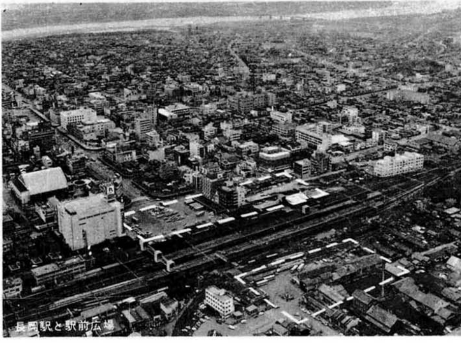
長岡駅と駅前広場

四月十三日、市と市議会は、国鉄当局に、上越新幹線建設に伴う長岡駅舎と駅前広場の整備について陳情いたしました。 上越新幹線は、ことし一月発表された二千五百分の一の地図によるルートのとおり、高架(約十三メートルの高さ)で、現在の長岡駅にはいることになっております。老朽いちじるしい長岡駅も、この機会に全面的に改築される見込みとなりました。いまのところプラットホームの長さは、四百四十メートルで、いかに延長され、駅舎の改築も、現位置から西側に十メートルほど張り出すものと予想されます。 今回の陳情は、この駅舎の改築と合わせて、発展する長岡市の表玄関にふさわしい、駅前広場の整備を要望したもので、