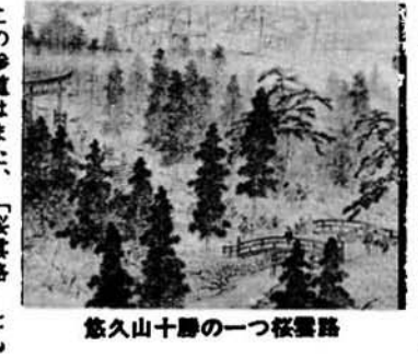
悠久山十勝の一つ桜雲路

●桜雲路(おううんじ) お山の千本桜 花は千咲くなる実は一いつ こよひまたまたまされた 桜林におしおばひとり (長岡甚句) 古くから市民の間に親しまれてきた長岡甚句の歌詩は、蒼紫神社の参道に植えられている桜並木をうたったものといわれています。 この参道はまた、「桜雲路」とも呼ばれていました。 悠久山十勝の一つに数えられたこの桜雲路は、天明元年、いまからおよそ百九十年前に蒼紫神社といっしょにつくられたといわれています。 そして、文政年間(一八〇〇年代)すでに「遠くにこれを望めば霞を布けるが如く、近くでこれを視れば横雲の如し」悠久山記と詠まれたように、長岡に住み、長岡に育った人々には忘れられないのでない風景の一つであり、自慢の一つでもありました。 しかし、時代の移り変わりは自然の風物までも変えて、桜花らんと薄れていくようです。 悠久山十勝は、大正五年に選ばれたもので、桜雲路のほかにも次の九つがあります。 (悠久遺芳―互尊文庫―) 揚柳井(ようりゅうい) 参道入口の右側にあったもので、柳の井戸と呼ばれていました。参道入口の左側にある大燈籠で、第二次大戦前は銅製でした。 立標碑(りゅうだひ) 参道にそって建立された先人の碑です。跡ももう橋(こもつきょう) 社殿にいちばん近い橋で、「へび橋」とも呼ばれています。 せんすい池(せんすい) せんすい池のことで、悠久山十勝のなかでも第一勝と書かれています。 飛艇峰(ひていほう) せんすい池の東側丘陵一帯をいいます。 君山(きんざん) お山焼きのかま場をいいたもので、社招魂社(しょうこんじや) 社殿うらの招魂社で、戊辰の役と西南の役で戦死した三百二十三名の