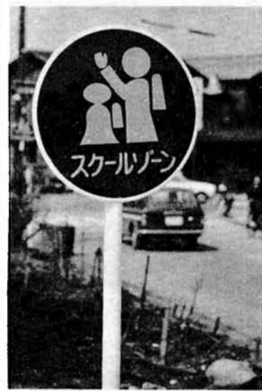
写真はスクール・ゾーンの標識。この標識内はさらに安全運転をお願いします。