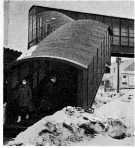
横断歩道橋を渡りましょう。国道17号線殿町附近を横断するときは、最も安全な歩道橋を渡ってください。子どもたちは、喜んで渡っていますから、とくにご婦人のご協力をお願いします。

開港 100年、震災復興を記念して、ことし7月8日から8月31日まで、新潟市松波町海浜で新潟大博覧会が盛大に行なわれます。 ただいま、景品のあたる前売券を発売していますので、ご購入の方は、市観光課へお求めください。 △前売券…大人 250円。 高校生 200円。小・中学生 130円(本券は教育委員会で取扱い) ▽発売期限…6月10日。