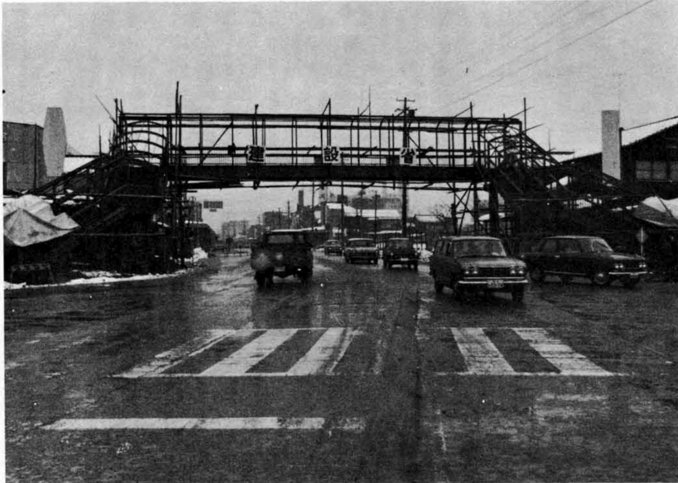
殿町交差点に架設された横断歩道橋