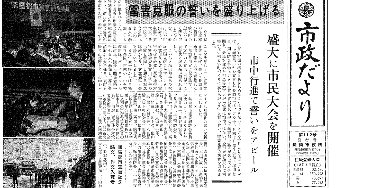
雪害克服の誓いを盛り上げる。市中行進で誓いをアピール。

盛大に市民大会を開催 市中行進で誓いをアピール 雪害克服の誓いを盛り上げる。市中行進で誓いをアピール。雪害克服の誓いを盛り上げる。市中行進で誓いをアピール。