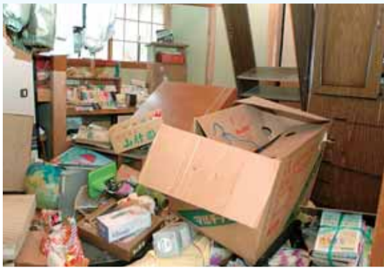
▶住宅にも大きな被害が(長岡地域大積三島谷町)

今後は、被災地域の復興に向け、被災された方々の生活再建支援に全力で取り組みます。