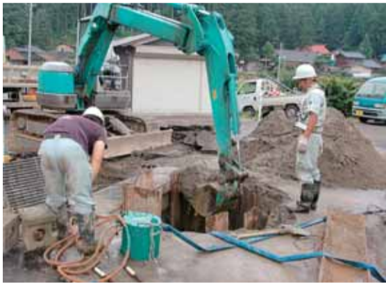
▶断水解消のため復旧作業が進められた和島高畑