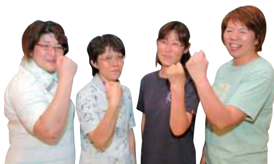
▲本番に向けて気合いの入るみなさん。今夜の前夜祭をお楽しみに!

私たちに元気と勇気をくれた長岡まつり。元気になった姿を見てもらおうと、今年は約50人で長岡甚句や大花火音頭の練習を続けてきました。民踊流しでは「山古志」の名前が入ったおそろいの浴衣でまつりを盛り上げます。みなさんも一緒に楽しみましょう。