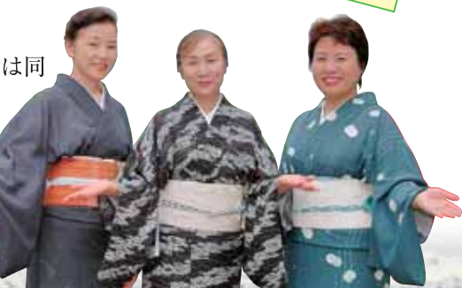
▲蓬平温泉の3旅館の女将。まごころでおもてなしいたします