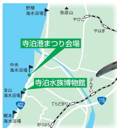
↑4つの海水浴場はココ!