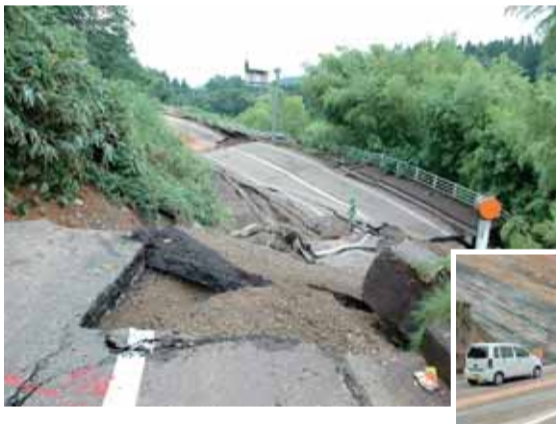
▶地すべりで崩落した長岡地域大積千本町地内の国道8号(右下は復旧後)