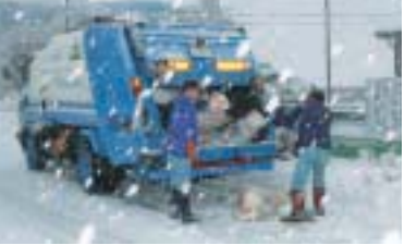
1月21日の収集作業で

【ごみを出す時間を守ってください】 「びん・缶・ペットボトル」「新聞・雑誌・チラシ・段ボール」「燃やさないごみ」「粗大ごみ」をごみステーションに出す時間は、全市、午前8時30分までです。「燃やすごみ」は、午前8時30分までの地域と、午後1時までの地域があります。 また、「びん・缶・ペットボトル」と「新聞・雑誌・チラシ・段ボール」は収集日が同じでも、リサイクル方法が違うため別々の車両で収集しています。収集が終わった後に出さないようご注意ください。 「新聞・雑誌・チラシ・段ボール」は子ども会や学校などで行う資源回収にもご協力ください。