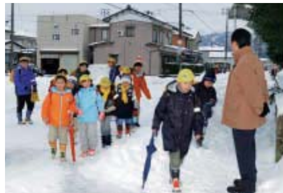
集団登校で（1月16日、上組小学校） 「先生、おはようございます！」。友達や先生と過ごす学校が楽しくて、寒くてもみんな元気に登校してきます。

就学校の変更については、以前から子どもたちの個別の事情に配慮し、弾力的に運用しています。 通学区域について、保護者の意向を把握するため、市教育委員会では、昨年七月に、「通学区制度に関するアンケート」を実施しました。 アンケート結果によると、学区外就学許可基準について、転居しても従来の学校に引き続き就学したいという要望が多くありました。 子どもたちの視点に立ち、よりよい基準に そこで、通学区域審議会などでさまざまな角度から検討した結果、転校による子どもたちの負担を軽減し、友達や先生との関係を継続させたいという要望にこたえるため、次の三点について緩和することにしました。