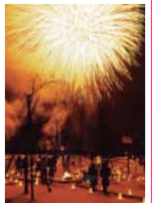
▶雪・火焰フェスティバル

積雪や天候等の状況により一部内容を変更する場合があります。 また、会場の駐車台数には限りがありますので路線バスをご利用ください。