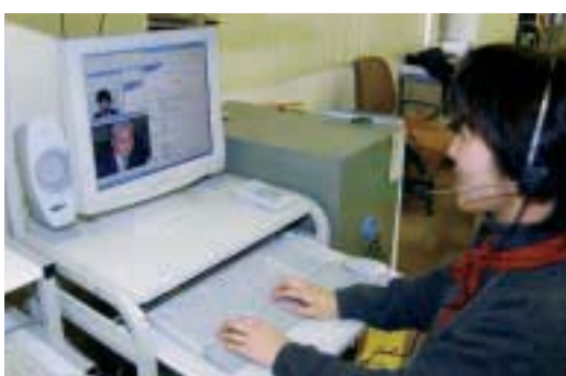
テレビ会議システム ながおか市民センターと健康センターの端末が結ばれていて、保健師などと対面式で健康相談や健診などの問い合わせができます。

を使って、ながおか市民センターから市の相談窓口と対話しながら健康相談や行政相談ができたり、コミュニティセンター（三力所）で、生涯学習講座や健康指導などを受けたりすることもできます。そのほか、起業者を支援す