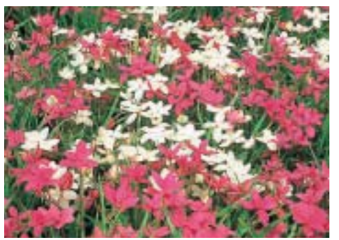
アツツザクラ(ロードヒポキシス)