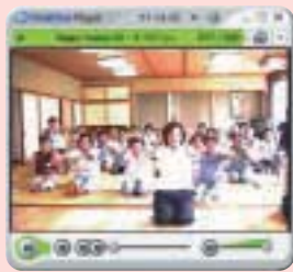
◀ハッピー体操（健康づくりビデオ）