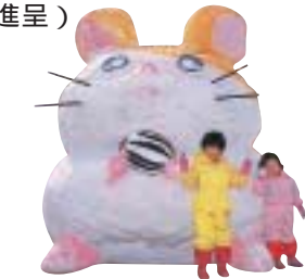
今年はどうな雪だるまがお目見えするかな?

ながおか100だるま大会 15日(土)・16日(日) 大賞作品には10万円相当の旅行券を進呈(ファミリー・子ども会部門は2作品に5万円進呈)