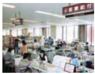
手続きは市役所1階 番 番窓口でどうぞ

高額医療費(療養費)の払い戻しに該当する人には、診療月の3〜4ヵ月後に、市から高額医療費(療養費)支給申請書をお送りします。申請書に必要事項を記入のうえ、市役所1階 番、番窓口にて提出または郵送してください。