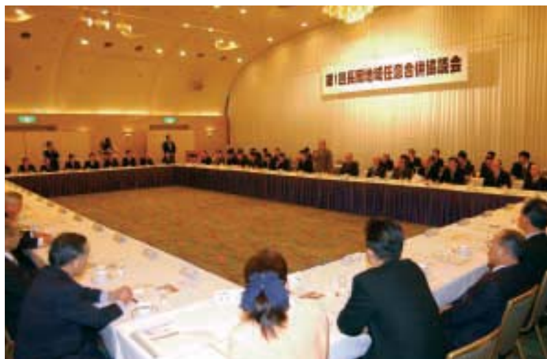
第1回長岡地域任意合併協議会 協議会は、参加8市町村の首長、助役、議長および議長が推薦した議員、住民代表、学識経験者代表51人の委員で構成されています。

の接続を開始します。これは、民間との共同実験として超高速ネットワークを整備し、どのような情報提供サービスが利用されるのかを検証するもので、全国的にも先進的な取り組みです。