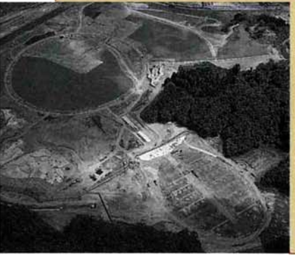
建設中の国営越後丘陵公園

建設中の国営越後丘陵公園で植樹祭を行います。平成の森づくりと施設の見学会にあなたも参加しませんか。 日時 10月10日(祝)午前10時～午後3時(小雨決行) 集合 長岡ニュータウン公園 対象 平成生まれの子どもがいる家庭 持ち物 移植ごて、長靴、雨具 申し込み 9月20日(金)までに往復はがきの往信の裏に「植樹祭」参加希望、住所、電話番号、参加者全員の氏名(ふりがな)、人数、生年月日を、返信の表に住所・氏名を記入して〒940幸町2の1の1市役所公園緑地課☎39・2230へ 申し込み多数の場合は抽選となります。