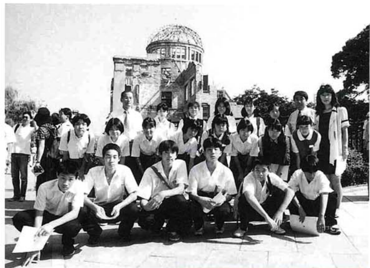
▲8月6日「平和祈念式」参列のあと 広島平和記念公園で原爆ドームを背に