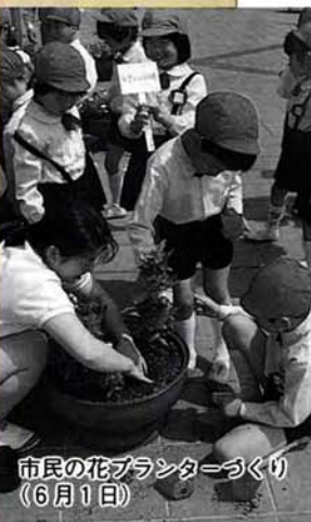
市民の花プランターづくり (6月1日)

時間=午前10時30分~午後4時 会場=音楽の森のせせらぎ周辺 茶席料=300円