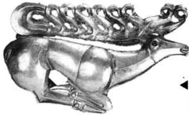
鹿紋章標飾 前7世紀末頃 31.7×19cm