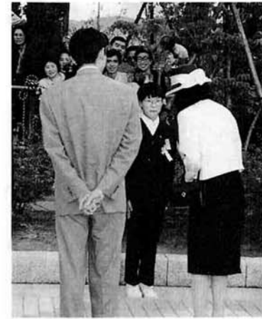
▶ハイブ長岡での式典 ▼小学生に声をかけられる両殿下