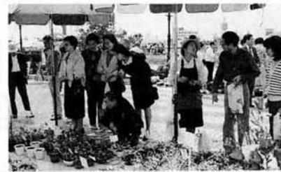
▲苗木などの即売会も好評

大会の主役をつとめた花たちは、サルビア、ペゴニア、パンジーなど全部で二十種近く。長岡駅から会場までの四・五段の沿道とケヤキ並木に三万株、会場につくられた「花の広場」に七万株、さらにハイブ長岡