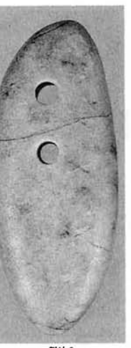
▲ヒスイの大珠（大きな玉）