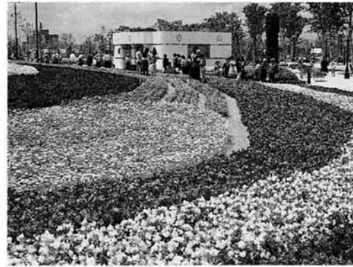
▲20種類の花がびっしりと植え込まれた「花の広場」。これからも季節にあわせて色とりどりの花が咲く