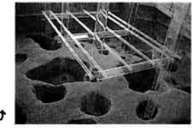
▶遺構展示館のなか