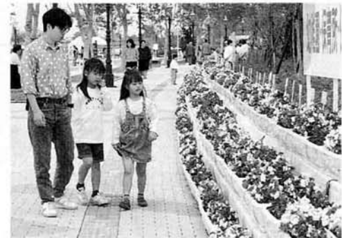
▲大会を飾ったプランターは約3,500個。いまは、花づくりのさかんな町内や学校、市の施設などにあずけられ、地域で利用されている