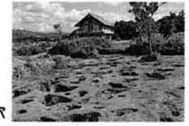
▶掘りだされた柱の穴