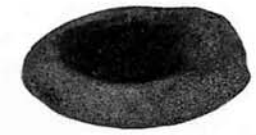
▲石の皿に結まった炭化物。トチノミヤドングリなどをすりつぶして、その粉を練って団子にして食べた

食べるほど、すごいことだったんだよ。それから、石の上ののっている、炭のようなものを見てほしい。これは、ただの炭じゃない。実は縄文人が残した食べ物なんだ。 そして、いろいろな石器や土偶、玉や耳飾りなども見逃せない。 石の槍や矢じりは、狩りに使ったことは知っているだろう。ほかのものは、どんなことに使ったのか、考えてみよう。博物館の人に聞けば、親切に教えてくれるよ。 さて、これで準備は十分だ。さっそく遺跡の探検に出発しよう。