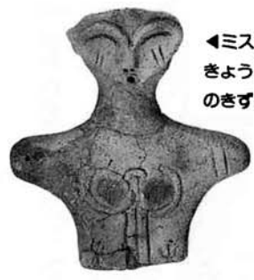
▲ミス馬高。なんとも愛きょうのある顔だ。ほほのきずはいれずみか?

犬を引き連れて、狩りや漁をし、えものはみんで分ける。冬にそなえ、木の実などは保存用の穴に蓄えただろう。ときには収穫に感謝し、お祭りをしたかもしれない。そんなたくましくて、やさしい縄文人の姿が浮かんでくるようだ。