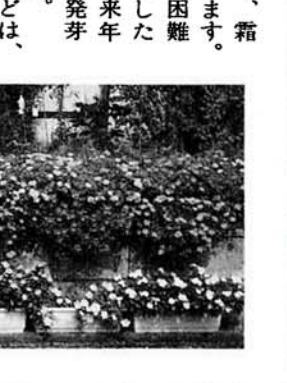
▲へいを見事に彩るハナスベリヒユの花