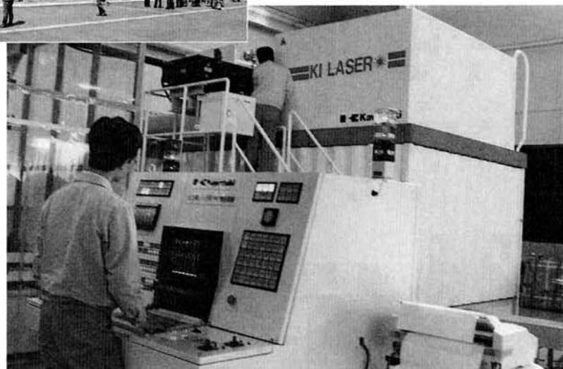
調整作業が進められるよう素レーザー加工機

昨年七月に、一部が開始していたレーザー応用工学センターが、四月一日に全面オープンを迎えました。 長岡技術科学大学の南側に完成した同センターは、全国の大学や国立研究所、企業から訪れるレーザー応用技術の研究者に、研究開発の場を提供する施設です。設置された最先端・高出力のレーザー装置計十二台の中には、一酸化