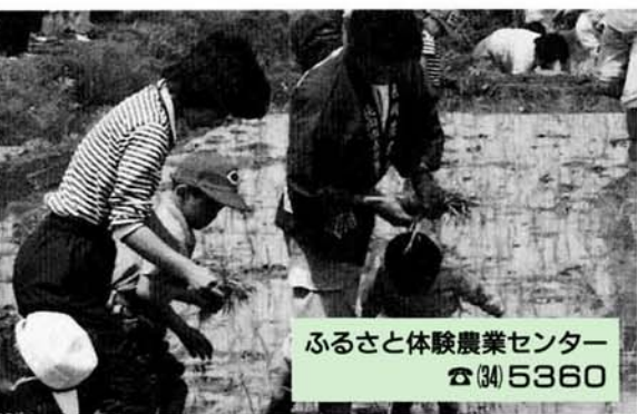
ふるさと体験農業センター ☎025360

7/19日 第8回ふるさとの民謡民舞まつり 11/6日 サグレフ・フィルハーモニー管弦楽団 11/15日 めいぐるみ人形劇 11/25日 ニニ・ロッソ演奏会