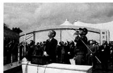
▼打ち上げられたモデルロケットを見上げる参加者たち