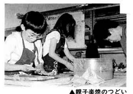
▲親子染焼のつどい

● 野鳥相を調べる会 日時 5月24日(日)午前5時～8時(雨天決行) 観察地 東山ファミリアランド周辺 集合 市営スキー場駐車場入口午前5時 対象 小学生以上 一般 持ち物 筆記用具、雨具、あれば双眼鏡も 申込み 5月22日(金)まで ● 親子染焼のつどい 日時 5月24日・6月7日・14日の各日曜日、午後1時30分 対象 小学3年生以上 高校生または親子 定員 20人 材料費 300円 申込み 5月14日(火)まで