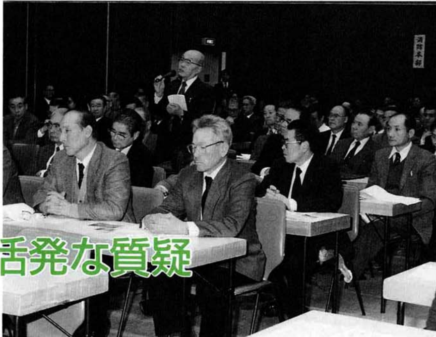
春の町内会長会議を開催