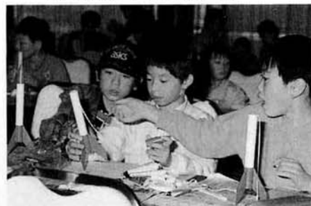
▼昨年10月に開催されたモデルロケット教室（ハイブ長岡にて）

スペースネオトピアの基本テーマは「宇宙に学び遊ぶ」。子どもだけでなく、大人にも夢を与えてくれるテーマパークをめざします。目標の年間入場者数は、当初は二百五十万人を、最終的には三百五十万人を見込んでいます。