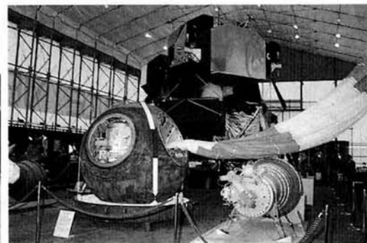
▲起工式の会場内には、アメリカのアポロ計画で、人類が初めて月面に降り立った時に使われた巨大な月面着陸船「アポロ11号」（写真中央の奥）など、宇宙開発の関連品を多数展示したプレジューム（宇宙開発ミニ展示場）が披露されました