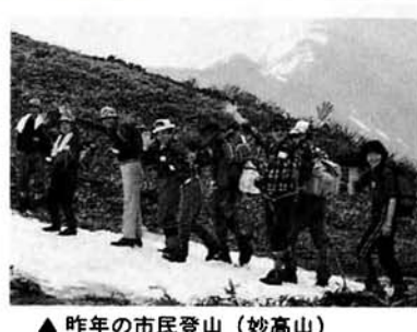
▲昨年市民登山(妙高山)

● 市民体育祭ソフトテニス大会(軟式庭球) 対象 高校生以上 定員 10人 参加料 1,000円 準備会 6月10日(水)午後6時 厚生会館中ホール 申込み 参加料を添えて5月21日(金)までに