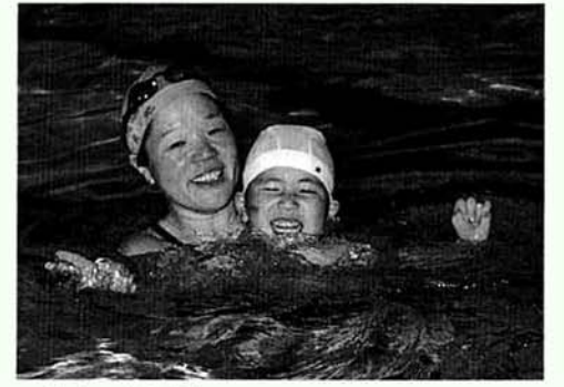
▲昨年の水泳教室で

期日 5月16日・23日・6月13日・20日・27日・7月4日・11日・18日の各土曜日、計8回 時間 午前11時～12時30分 会場 青少年文化センター内温水プール 指導 長岡婦人水泳クラブ 参加料 600円(傷害保険料等) 申込み 福祉課☎39-2217へ5月12日(火)までに