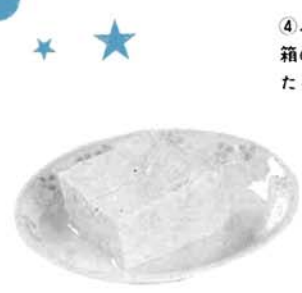
水の中で取り出して、おいしい木綿豆腐のできあがり。