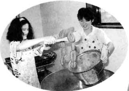
⑦くん製が終わればもう食べられますが、殺菌のために70-80℃のお湯で15分ほど煮ます。はい、これでできあがり。