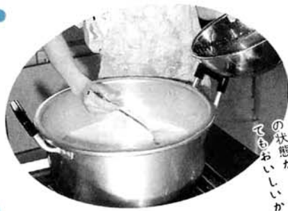
③こした汁が65℃になったら、沸騰した凝固剤を手早く混ぜます。とろろの状態が「おぼろ豆腐」です。とてもおいしいからぜひ食べて！