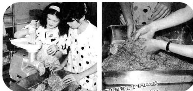
②肉をひきます（はじめからひき肉を用意してもよいでしょう）。ひいた肉に牛乳と卵を入れ、温度が上がらないように氷水を入れながらよく練り合わせます。