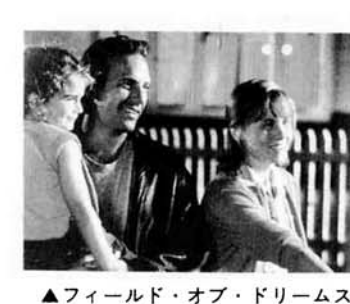
▲フィールド・オブ・ドリームス

●失ったものは帰ってくる! 自主上映会のお知らせ 長岡から映画館がなくなって4か月が経ちました。この自主上映会は市民映画館を作るための旗揚げの行事です。ぜひご覧になって、映画の魅力、迫力、感動を存分に味わってください。 上映作品①フィールド・オブ・ドリームス(1989年アメリカ) 日時②7月14日(日)午後1時20分～9時(3回上映、間にシンポジウムを開催) 会場③長岡市立劇場 高校生以上1,000円、小・中学生500円(当日は500円増し) 市内のプレイガイドでお求めください。問い合わせ④市民映画館をつくる準備会(長岡商工会議所内) ☎32-145