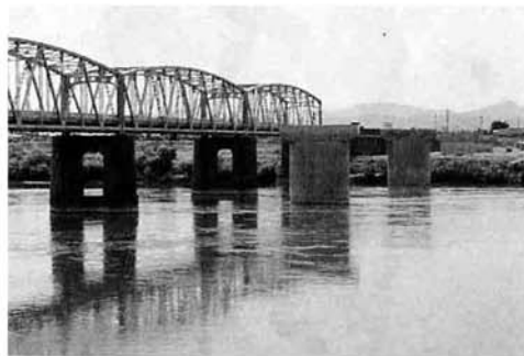
▲現在の蔵王橋に沿って建てられた橋脚

新しい蔵王橋は、完成すると全長八百八十四メートル、幅員十二メートルで、現在の橋の二倍以上の幅員になります。来年度以降には、いよいよ橋の上部工事に入り、平成六年供用開始をめざして工事が進むことになっていきます。