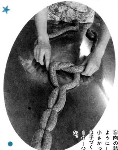
⑤肉の詰まった腸を、ひもをしぼるようにして結びます。大きかったり小さかったりばらばらだけど、そこは手づくりならではの愛さよう。ソーセージづくりで一歩楽しい作業か