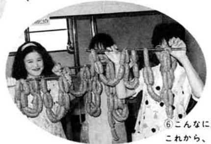
⑥こんなに上手にできました。ではこれから、くん製箱の中で乾燥（30分）し、桜などのチップでくん製します（2時間）。

ふるさと体験農業センターには、真空パックの機械や豆腐容器を包装する機械もあります。