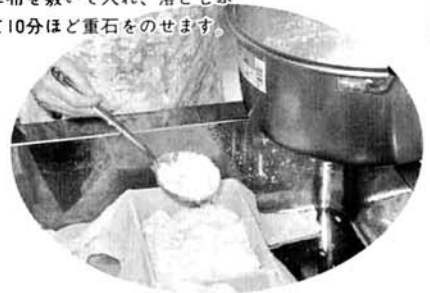
④ふたをして10分ほどおいた後、型箱の中に布を敷いて入れ、落としぶたをして10分ほど重石をのせます。