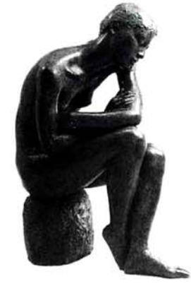
女 1981 96×38×68cm

日時 7月27日(金)午後7時～9時 会場 講座室1 内容 有島武郎著「惜しみなく愛は奪う」を話題にして