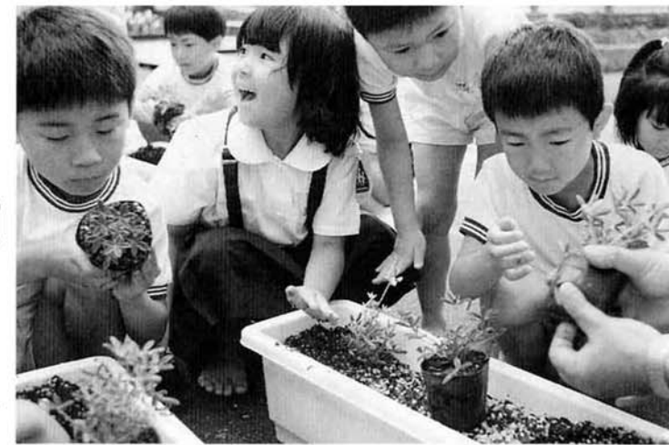
▲めずらしそうに苗を植える神田小学校の子どもたち

フォートワースの花「ブルーボンネット」をご存じですか? いま、このブルーボンネットの苗を、市内の小・中学校の子どもたちが、たいせつに育てています。