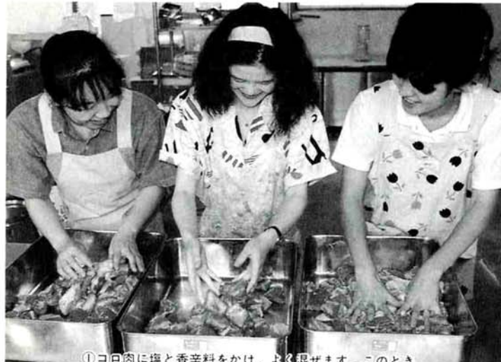
①こ肉に塩と香辛料をかけ、よく混ぜます。このとき手やバットは冷たくしておきましょう。冷たいほうがひき肉にして混ぜたとき肉のくっつきがよいのだそうです。

材料（8.5kg分）…豚のこ肉10kg（肩、モモ、バラなどで、脂肪分を10%位に。冷凍肉は、練ってもまとまりにくいので注意）、食塩300g、香辛料（コショウ、月桂樹の葉、タイムなど）、牛乳500cc、卵10こ、豚の腸（または羊の腸。豚の方が太くて詰りやすい）