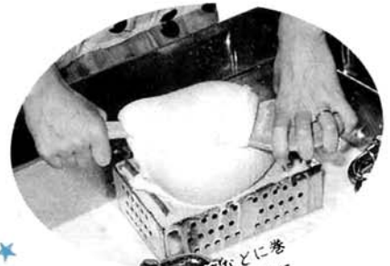
②豆汁をこし袋に入れ、濾などに巻つけて絞ります。こした汁が豆乳になり、袋の中に残るのはおから。手づくりだと機械のようにしっかりと絞れないので、豆乳の多いおいしいおからが残ります。

①大豆に水を加え、ミキサーにかけたあと強火で煮ます。こげつかないように混ぜながら沸騰させます。吹きこぼれる寸前に消泡剤を入れるのがポイント。早すぎると豆臭が残るし、間に合わないこのことお。あーあ、吹きこぼれちゃった。残念そうな巻測さん。