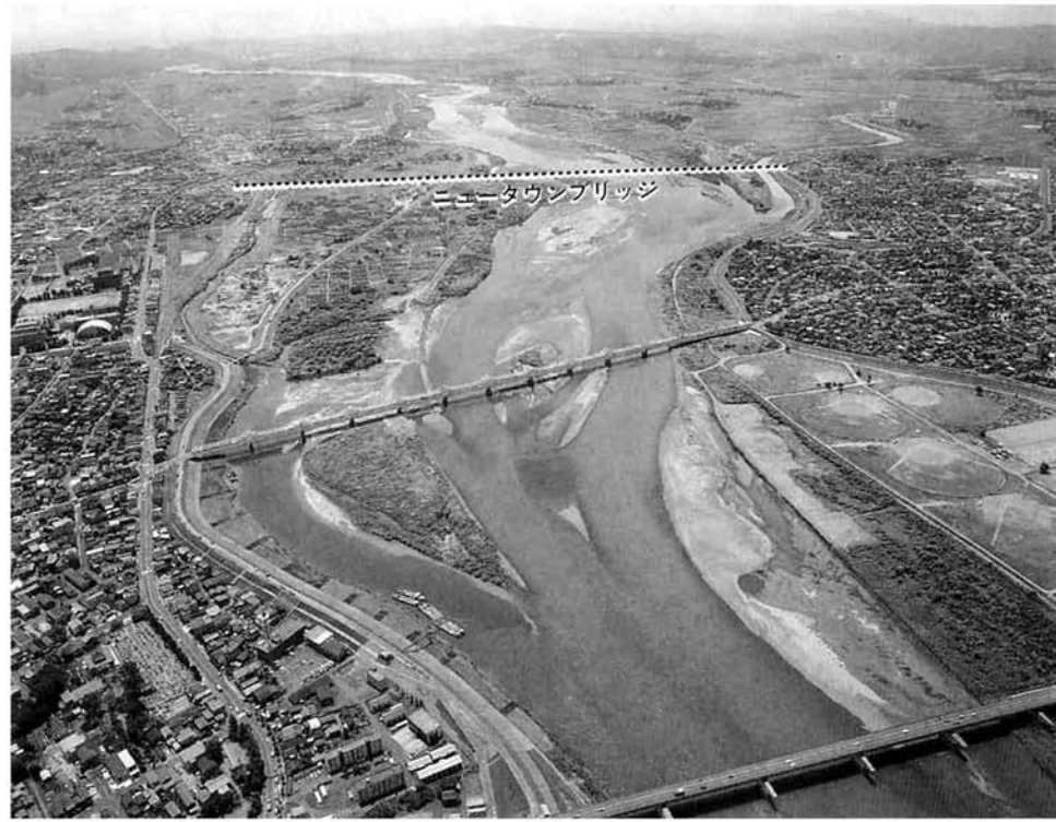
▲信濃川の両岸に広がるまち並み。長生橋から約1.8km上流にニュータウンブリッジが計画されている

長岡のまちの発展に欠かせない橋、ニュータウンブリッジ。国営公園や宇宙博物館（スペースオトピア）の建設が決まって、その役割はますます大きくなっています。この新しい橋の早期着工に向けて市民ぐるみの運動を進めるため、今月十二日に市民大会を開催し、官民一体の新しい組織を発足させることになりました。