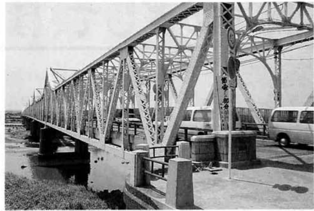
▲信濃川にかかる橋の中で最も古い歴史を持つ長生橋。いまでも、毎日ひっきりなしに車が行き交う

いま、信濃川をはさんだ市内の東西交通を支えている橋は、上流から長生橋、大手大橋、長岡大橋、蔵王橋の四本です。これに越路橋を加えた五本の橋の交通量は、昭和六十年の調査で一日当たり約六千八百台（最高は長生橋の約