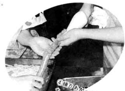
④練りあがったひき肉を腸に詰めます。この時、肉を絞り出す人と腸を引き出す人の呼吸が大切。合わないとう息が入ったり、肉がつまり過ぎたりしてパンクしたりします。