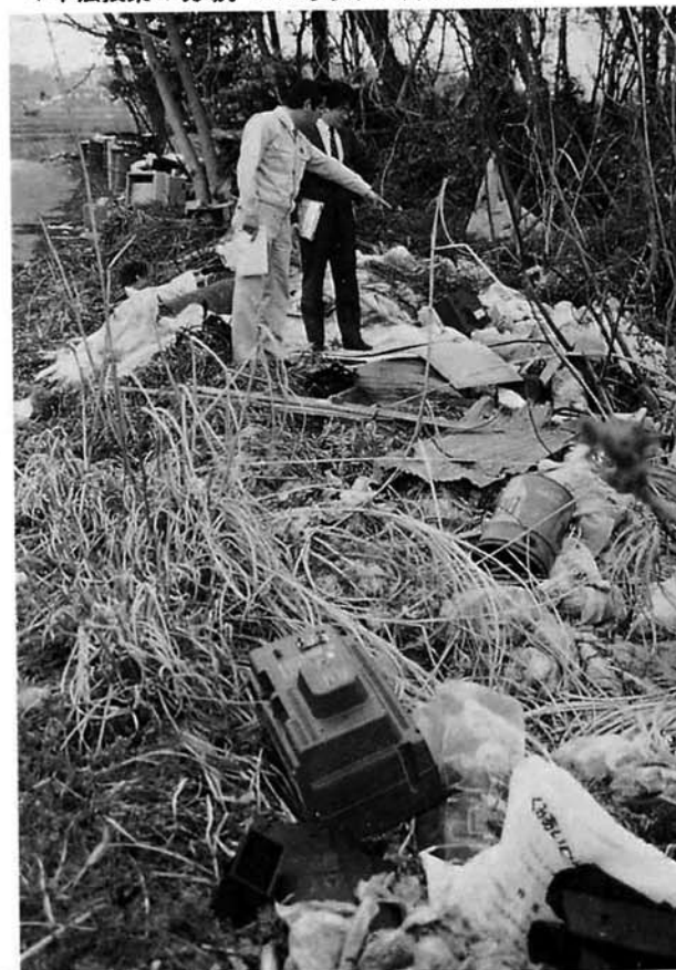
▼不法投棄の現場。こんな状況が許せますか?