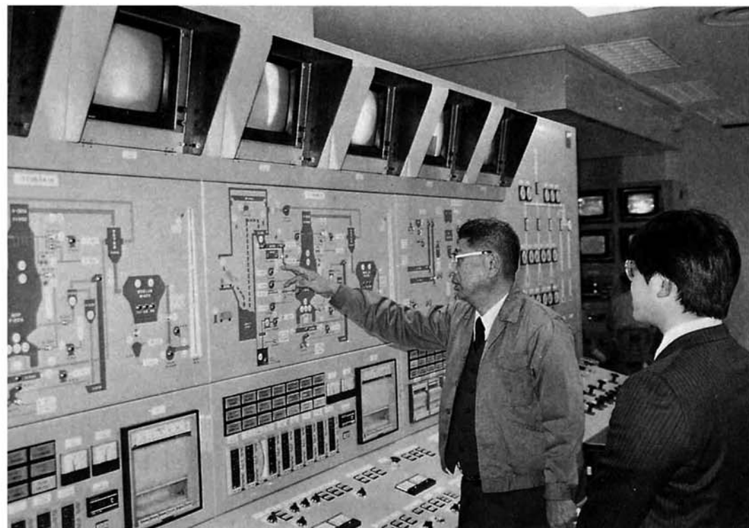
▲鳥越ごみ焼却場の中央操作室。焼却作業はすべてコンピュータにより遠隔操作されるので、作業でごみに触れることはない

「市民一人が一日に出すごみの量は約〇・八キロ。これを集めて処理する経費は、四人家族の一世帯あたり年間約二万一千円です」長岡市のごみについてレポートするため、最初にたずねた環境衛生センターでうかがった話です。ごみの処理費用が一世帯で年間二万円といえば、大したことないようにも思いますが、市全体では年間約十億円の消費になるとか。たいへんな金額ですね。 「ごみの水分を少なくしていただけでも、ずいぶん助かるんですが……。ぜひ生ごみ処理器によって、ご家庭の生ごみを肥料として活用していただきたい。」