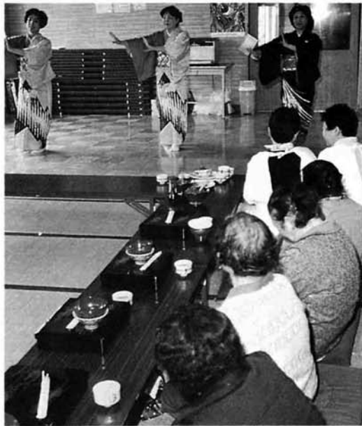
▲食後に、ボランティアで参加した地元の民謡愛好会「こすもす会」の見事な踊りを楽しみました

市では、こうした給食サービスがほかの地域にも広がるよう、その活動のための組織づくりや運営についてお手伝いしています。詳しくは、市役所福祉課 35-1-1-2 または市社会福祉協議会 33-1-6000 にご相談ください。