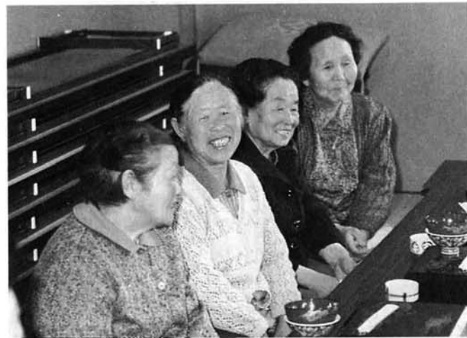
◀「ごちそうさまでした」おいしい食事のあとは、話はずみずみ

だれでも食事は大勢で楽しくとりたいたいもの。特にひとり暮らしのお年寄りにとっては、大勢の人といっしょに食事をしたりすることで、元気づけられることも多いのではないだろうか。そんな思いから、関原地区では、お年寄りのために毎月昼食会を開いています。そこから、どんなふうにも地域の輪が広がっているの。四月十五日の土曜日に開かれた昼食会におじゃましました。