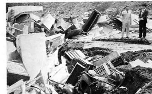
▲粗大ごみの埋立地。ブルドーザーでつぶし、かさを少なくして埋め立てている