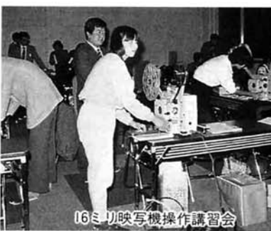
16mm映写機操作講習会

技術のめざましい進歩を覗くください。 日時 6月11日(日) 午前9時30分～午後1時 会場 水道局中島浄水場(水道町3) 問い合わせ 水道局業務課 ☎34-一四二二