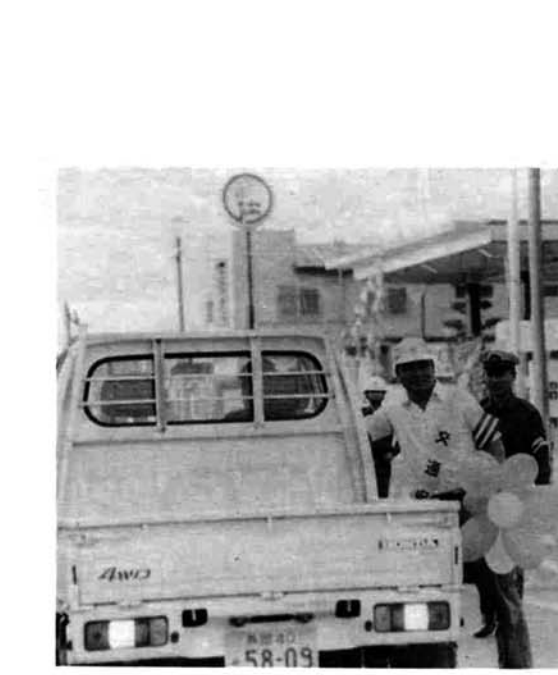
運転者におにぎりを