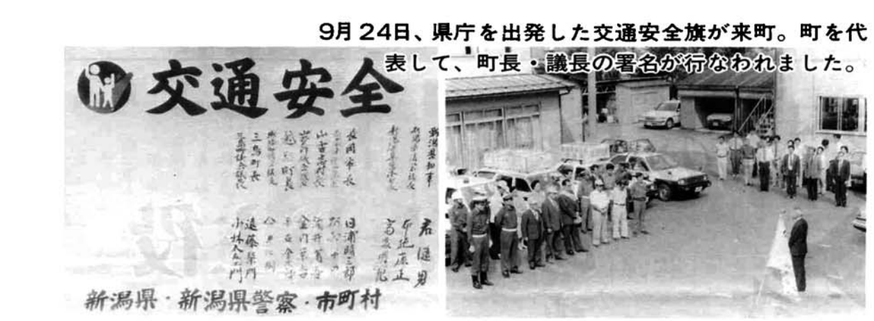
9月24日、県庁を出発した交通安全旗が来町。町を代表して、町長・議長の署名が行なわれました。