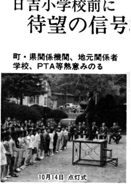
日吉小学校前に待望の信号 町・県関係機関、地元関係者学校、PTA等熱意みのる 10月14日 点灯式