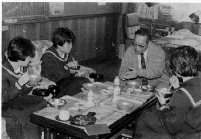
話がはずむ3人面接。

この会食のことを、生徒は三人面接と呼んでいる。 校長先生にお聞きすると、校長先生も生徒と何とか直接ふれ合いが行なえる場が欲しいという事でこの方法を考えられたという。 大人であれば一杯くみかわしながら話す事が一番の早道であ