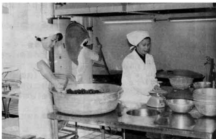
260名の我が子のために……

教育の本道は対話にある…… これは校長先生の持論であり、人間的なふれ合いのなかで、人間としての生きざまについて、本音で語り合うことのような機会はおそらく生徒達にとって貴重な体験となる事でしょう。 校長室だけでなく、各教室においても給食は小グループになって、いろんな会話のなかで、又担任の先生も順に仲間入りして会食されてお