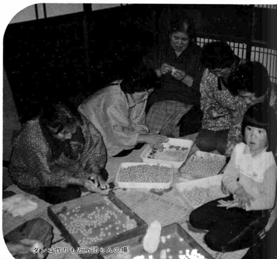
ダシヨ作りも近所団らんの場