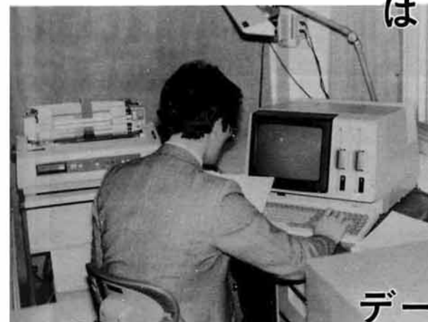
毎日データの入力が行われております

厚生省は、老人保健法の施行以来、老人の健康づくりに、さらに弾みをつけようと、老人保健特別対策事業を実施し、健康づくりなど保健事業に熱心な市町村に対し、さらにモデル的なケースとして育成するため、補助をするもので、県内でただ一か所三島町が選ばれました。 三島町がとりくむ具体的な事業内容は、コンピュータを導入して、コンピュータによる健康管理システムを実施するもので、このシステムによって、住民検診のデータなどを管理し、検診