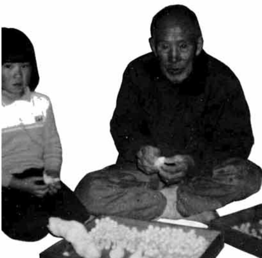
えごの子はこうして作るんだよ

(紙面で紹介の気比宮浄正寺では、毎年3月第3日曜日に行なわれております。写真は昨年のもので)