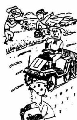
農業センサスにご協力ください

調査員がお伺い した際には、統計の重要性をご認識のうえご協力とご理解をぜひお願いいたします。