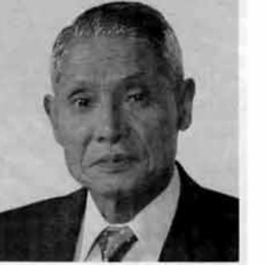
新年明けましておめでとうございます。昭和五十九年は豪雪に明け豪雪で暮れた年でありました。町民の皆さんは雪との戦いの年末年始でございましたが、皆さんが健康で新しく迎えられる昭和六十年は昭和の選歴の年であり戦後四十年という節目でもあります。この新年が平和で景気上昇の