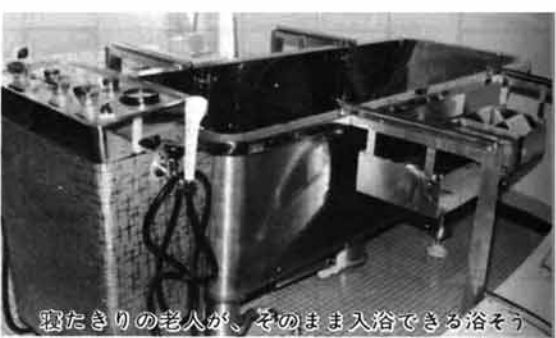
寝たきりの老人が、そのまま入浴できる浴槽

ら十一月までの間、毎週火・金曜日の午前八時に実施しております。 利用料金は一回につき八百十九円とわずかです。利用日には家族の方から、おひとり付き添いに同伴していただくことになっております。 希望される方は福祉係までご相談下さい。