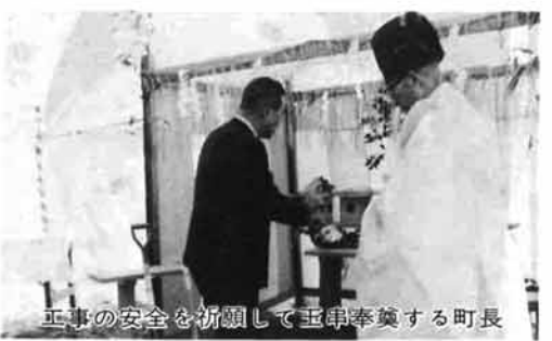
町長の五半率築を祈願して工事の安全を祈願

上記の窓口のほか、役場産業課、三島町商工会に用意してあります。 なお、借入れ希望額が資金枠を超えた場合は、抽選など公正な方法で貸付予定者が決定されます。 この制度に関する詳しいことは、各金融機関、商工会、役場産業課にお気軽におたずねください。