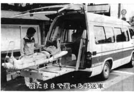
寝たまま運べる移送車

一般のご家庭で寝たきりの老人を入浴させることは、風呂の構造や介添え人が必要なことなどから、困難が多くあります。そんなご家庭のために町が、特別養護老人ホーム「みしま園」と業務委託を結んで実施しているもので、専用移送車(写真)で、病人を寝たまままで無理に動かすことなく運び、寝たきりのまま入浴できる浴槽で寝母さんから入浴を介添えしていただくという制度です。 このデイサービスは、四月か