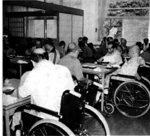
◀明るいムードの食堂