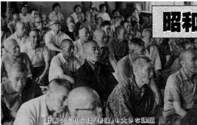
計画づくりには「老後」も大きな課題

答申が出され、議会の議決を経て計画が策定されると、町政運営のあらゆる計画の上位計画として位置づけられます。四十七年に策定された