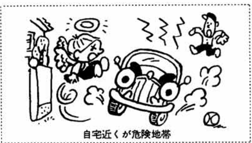
自宅近くが危険地帯