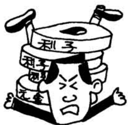
サラ金の気軽なイメージ

商売には商道徳といわれる。商売の道徳があり、大部分の業者は良心的な商活動を営み、わたしたち消費者と相互扶助のようになかちで社会生活が成り立っています。 しかし、消費者の無知や欲につけ込んだ悪徳商法、脱法商法もやたらと多く、新聞の社会面をにぎわしています。 もちろん、そんな商法に引いつける消費者に一番責任がありますが、何しろ手の込んだあの手、この手について...。というのが実態のようです。身近な事例でその一つ、二つを取りあげてみました。