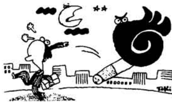
8年間たばこがトップ

所得税、事業税、住民税(県町民税)の申告をする時期がきました。毎年のことですので要領はおわりのことと思います。 長岡税務署では「申告や納税のことわからないことは遠慮なく