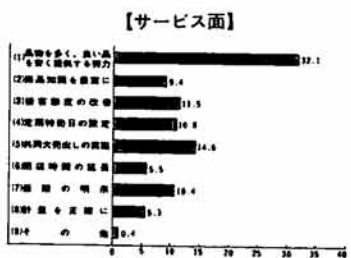
第I表 あなたは、地元商店街にどんなことを望みますか

三島郡と、長岡の旧三島郡地区八つの商工会で組織する「三島郡地区商工業振興協議会」が、さきほど「地域活動事業調査研究報告書」を発表しました。この報告書は、社会環境や情勢