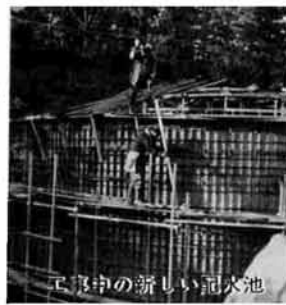
建設中の新しい配水池

さらに機動力を充実 今年度の除雪計画 冬期間の「足」を確保する今年度の除雪計画がまとまりました。まず、大きく変わったのは逆谷に入る県道が今年から県の委託路線となり越後交通が受け持ちます。さらに町の機動力を充実するため、二の路線が民間委託となりました。これによって浮いた力を、従来の路線に集中するので、除雪事情は好転したと建設課ではいっています。とはいってもスノーブラス作業には沿線住民の協力が何より大切です。道路に車を止めない、危険な所を表示、道路近くの建造物の囲いなど毎年お願い事項には、積極的な協力をと望んでいます。それと、大惨事につながりかねない火災、冬期間は特に念入りに火の元を確認してください。