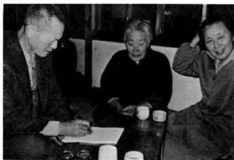
調査の協力依頼を受けた大字蓮花寺では、部落内の三十人を超えるお年よりを総動員、全面的な協力をしました。

昔話知らねえかの行十名が、蓮花寺部落を訪ずれ、村に伝わるいろいろな言い伝えなどを調査しました。