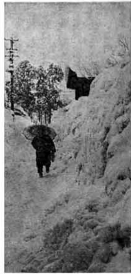
4メートルを超す雪の壁、歩くのが確実な方法であった(鳥越地内)