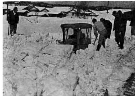
二月十八日の水道の断水、漏水の「線」がわかって、その「点」の発見に、ブルドーザーも出動して四時間あまりの苦闘。