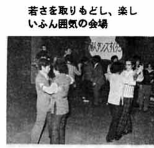
若さを取りもどし、楽しいふん団気の会場