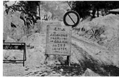
「難所」中永峠は約1カ月間も交通止め