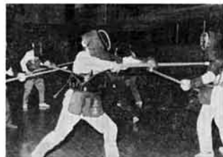
エイッ！の気合も若々しい

ことを目的としています。したがって強制的に加入をすすめたりするものではありませんが該当する人へまだ加入しておられない方はぜひ一度福祉係の窓口で相談してみてください。