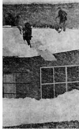
来る日も来る日も鉛色の空、晴れたら雪おろしなどとは言っていられず降りしきる雪の中でも、「むだ仕事」が続けられた(脇野町地内)

三月十日現在の積算降雪量は九・八センチにも達し、町にある記録(三十三年以降)のなかでは最高を記録しました。積雪深では三十八年には及ばないものの、「純白」のイメージとはあまりにも違った今年の冬を写真でふり返ってみました。