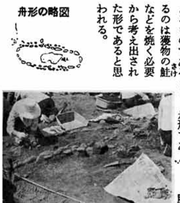
舟形の略図 舟形で、縄文中期の信濃川沿岸の炉のほとんどが長方形であるのに対し、舟形の炉は珍しいことである。この炉は周囲を数多くの石でふちどりしているが、これは附近に大きな石がなかったことによるものであろうし、舟形であるのは獲物の足などを焼く必要から考え出された形であると思われる。

縄文期の人々は、土を四、五十センチほど掘り下げて小屋を造り、中に炉を築いて住んだ。これを堅穴住居といっている。千石原では時代順に重なった三層の住居址が発掘されている。その最上層部から、関原の馬高式文化時代と同時期の火焔土器が出土しているが、この部分で石に囲まれた「舟形炉」も発掘された。長さはおよそ一・八メートル、幅六十