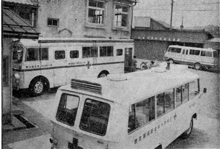
(採血の体勢にはいる、ゆうあい号)

今年三日の献血に、一七二名のかたからおいでいただき、うち、一五六名のかたが献血されました。 最近、血液不足と献血の重要性が論じられており、町民のみならず、積極的に協力いただき、御礼申し上げます。 また、区長、町内会長さんをはじめ、部落(町内)役員さんからもご協力いただきありがとうございます。今後もよろしくお願いたします。 ◆年次別献血のようす 四〇年一月 八 (人) 四一年一月 六 (人) 四二年一月 三 (人) 四三年一月 三 (人) 四四年一月 七 (人) 四五年一月 三 (人) 四六年一月 三 (人) 四七年一月 三 (人) 四八年一月 三 (人) 四九年一月 三 (人) 五〇年一月 三 (人) 合計 三六 (人) 応募者 献血者