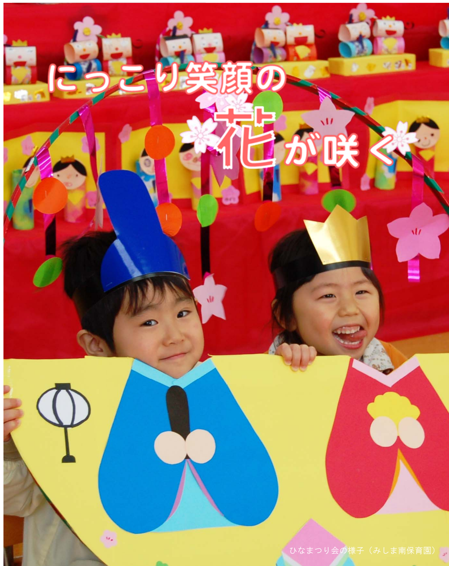
ひなまつり会の様子（みしま南保育園）