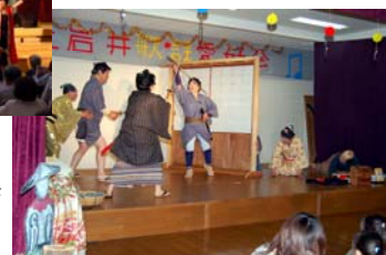
上岩井歌謡愛好会 ▼発表会(5月10日)

各地区で地域団体によるイベントが開催されました。歌や踊り、演劇などで会場は大盛り上がり！会場いっぱい拍手や笑いの渦が巻き起こりました。