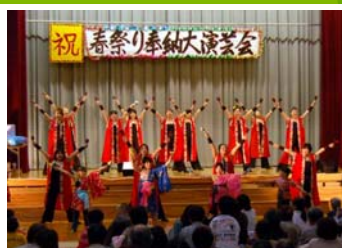
▲ドリーム 21TORIGOE 鳥越春祭り奉納大演芸会 (4月29日)