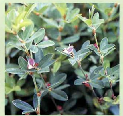
撮影日 一九九〇年八月一六日 場所 鳥越字上西田 (写真・文 奈良場正一)

みしまの植物 ⑤ ヤハズソウ(マメ科) 方言 はさみぐさ 日当たりのよい道ばた、草地に生える一年草。茎は一〇センチ位だがよく分枝し、一本でも大きく繁るので、群生すると地面を覆ってしまふ。花期は八月から九月で、葉のつけ根に小さな紫紅色の蝶形花をつける。葉は三枚の小葉からなり、小葉の側脈がきちんと葉縁まで達している。葉先を摘んで引くと、矢筈状に切れることから「矢筈草」となったという。子どものころ、川泳ぎの休憩でこの葉を「握り鉄」状に切って遊んだ。