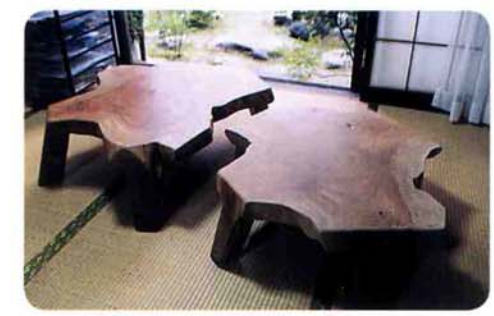
▲チェンソーによるケヤキの一刀彫 足も板もつながっている

刃渡り90センチのチェンソーを使いこなして 数年前中水地内の道路拡張の際に抜かれたケヤキの木を材料にして作ったという二つのケヤキのテーブル。根っこの部分がテーブルの足になるようになっています。