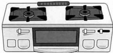
立消え安全装置付きガステーブル

お料理など、生活のさまざまなシーンで活躍しているガス。そのガスをもっと快適に、安全にご利用いただくために、セーフティガス機器のご使用をおすすめします。イザというときにガスが自動的にストップしたり、万一のガス漏れをキャッチ。セーフティガス機器で、「安心ガ斯拉イフ」をはじめましょう!