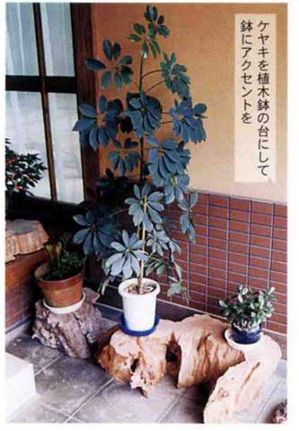
ケヤキを植木鉢の台にして鉢にアクセントを

く利用したというこの二つのテーブルは、同じ一本の木から作られているため、びつたりと重なります。