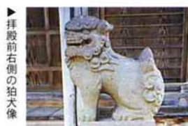
▶ 拝殿前右側の狛犬像

新保 神明社拝殿前の高台に置かれた一対の奉納狛犬像がある。台座の裏面には次の様に刻んである。 ○ 奉納された明治三年をめぐって 「力石にまつわる話」(広報 平成