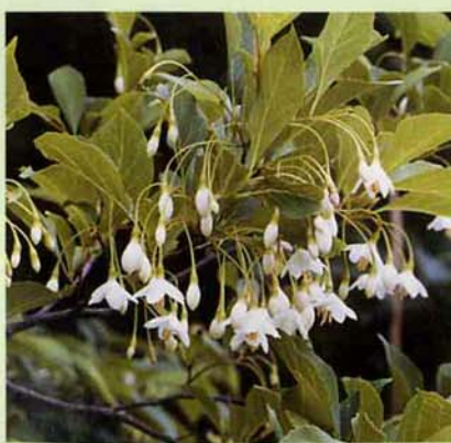
撮影日 一九九〇年五月三〇日 場所 鳥越字別当山 (写真・文 奈良場正一)

若い果皮はサポニンを含み、潰して水を含ませるとよく泡立つ。昔の人は洗濯に用いたり、潰した果皮を川に投げ込み、有害成分で魚を仮死状態にして捕った(現在は禁止)という。