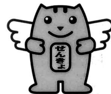
選挙のめいすいくん

投票日 8月10日(日) 告示日 8月5日(火) 立候補予定者説明会 日 時 6月30日(月) 午後1時30分から 会 場 三島町役場大会議室 議員定数 16人 任 期 平成15年9月1日~ 平成19年8月31日 問い合わせ先 三島町選挙管理委員会 TEL 42-2221 (内線312)