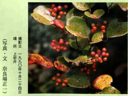
撮影日 一九九〇年十月二十四日 場所 上岩井 (写真・文 奈良場正一)

みしまの植物 ⑳ サルトリイバラ (ユリ科) 方言 さるかきいばら たんきりいばら ユリ科のつる性木本植物で、巻きひげで他物に絡みつく。町内では広く分布し、山裾の林縁、山道沿いなどでよく見かける。雌雄異株で果実は雌株しか成らない。名は茎に刺があって猿もひつかかるとか、猿がこの実を好むので罌を仕掛けるとき餌にするからとかいわれている。四く五月に葉とともに淡黄緑色の花を開く、果実は十く十一月に赤く熟し生花の花材に好まれる。