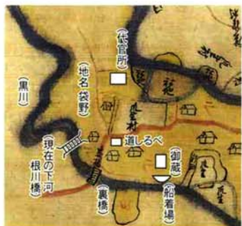
■明治2年の村絵図。代官所、御蔵は推定。黒川は河川改修され現下河根川橋は2回目もの。

米やその他の年貢物を納める いくつかの蔵や代官の詰める御 用旅家、村役人の詰める御蔵掛