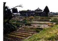
■黒川の土手下の「おくら跡」と呼んでいる畑地

下河根川地内に石柱の道しるべがある。 右 おやく所 新潟 左 いづも崎 与板 とよめる。長岡領は天和四年(一六八四) 牧野忠成の入封で始まるが、下河根川村は終始長岡領であった。 他の領地と同じく長岡領も、いくつかの村々を「組」としてまとめ、その領地の年貢物を納める御蔵と、村人を支配する役