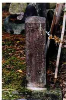
■倉重忠衛門宅の庭先にある高さ66cm、幅18cmの道しるべ

御蔵所まつわるものは今や「道しるべ」しかないが、かつては人馬や、舟は水量の多い時は中条の舟着場まで上ったりして、たいそうにぎわっていたであろう。(文 中村勝栄)