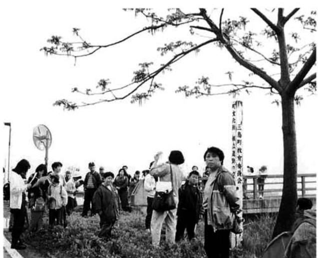
●タウトレイルハイキング 5月12日、町のいいところを探ろうと、「タウトレイルはいきんぐ」が行われました。約50人が鳥越ごみ処理場をスタートし、根立遺跡のほか、明新館支館跡、西照寺、中央公園などを見学しました。

●6月からの芝生広場も開放されています。子ども広場には、中央土地区画整理組合の寄贈で遊具が設置されています。親子で、お孫さんを連れて皆さんお出でください。 ●また、蓮花寺地区において本年度、(仮称)大杉公園の工事が着工されます。家族やグループで利用できる林間公園が来年度完成の予定です。