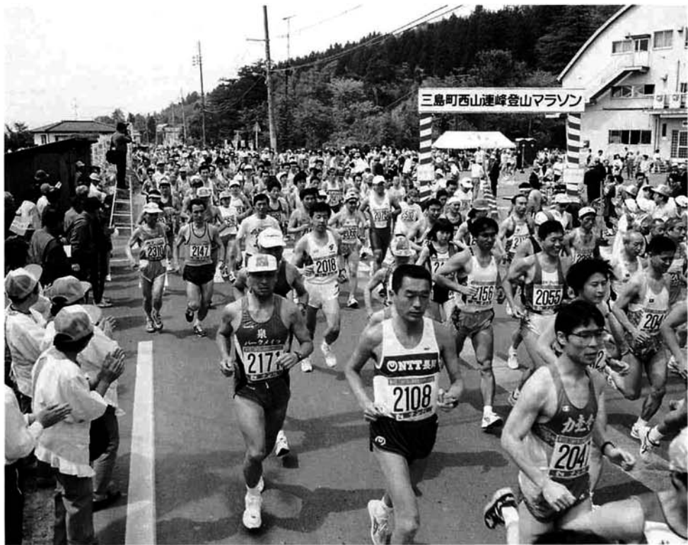
今回から20キロ、11キロ、3キロコースごとに時間差をつけてスタート