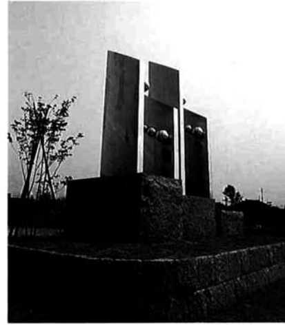
三島町中央土地区画整理事業 完工記念モニュメント

光のシャワーを浴びながら水とたわむれる子どもたちの姿 季節を感じる樹、草、花、そして心のやすらぎ 嬉しさも楽しさも満載、家族のコミュニケーションが深まります 憩い、くつろぎの場として是非どうぞ