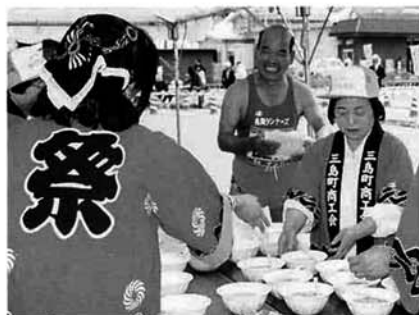
走り終えたランナーに好評だった「とん汁サービス」