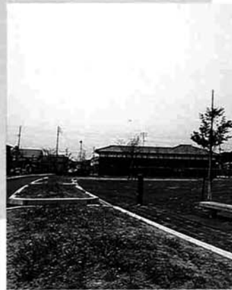
みどりのプロムナード 町民花壇、修景路