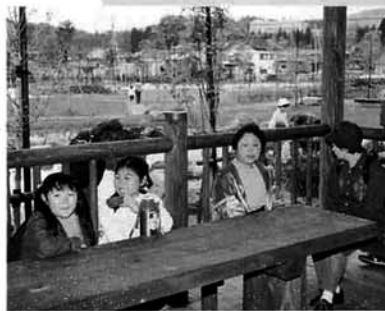
東屋・観月台 修景ゾーン、日本庭園を望む