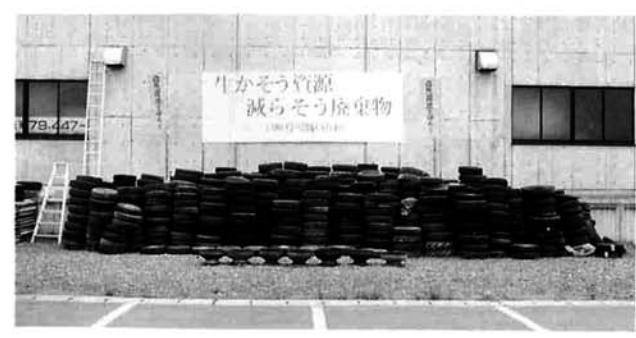
長岡リリックホールパンフレット

廃タイヤ・廃バッテリー回収のお礼 職員互助会 内線311 8日早朝、役場職員互助会がボランティア活動として実施しました廃タイヤ・廃バッテリーの回収につきましては、多くの町民の皆さんよりご協力をいただきありがとうございます。回収されたタイヤは645本、バッテリーは170個となりました。これらは、皆様からいただいた料金(総額19万9,050円)でリサイクルされます。