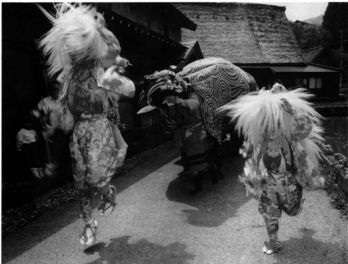
平成6年(第49回) 県展写真の部 入選

平成 6 年 6 月 15 日 発行 新潟県三島郡三島町役場 ☎ (0258) (代) 42-2221 印刷 長岡市 あかつき印刷