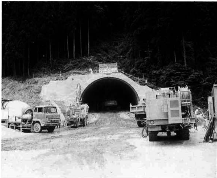
▼掘削するのは「ツインヘッダー」といわれる建設機械