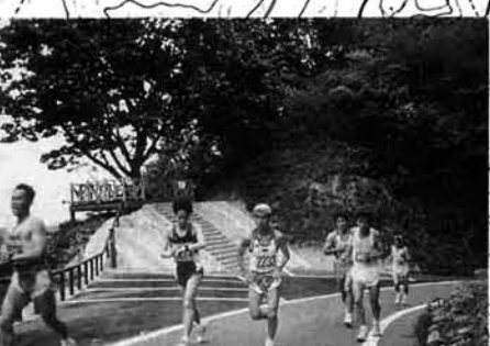
イタヤカエデ(落葉広葉高木)の根元に設けられた展望台は「険城台」