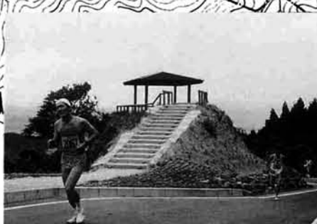
越後平野が一望できる「扇城台」