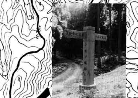
分岐点に立つ案内板