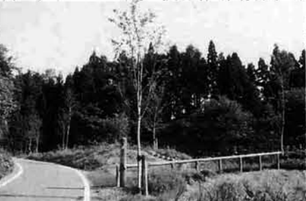
ソメイヨシノが植えられた「桜の宮」展望台付近。春には桜並木に