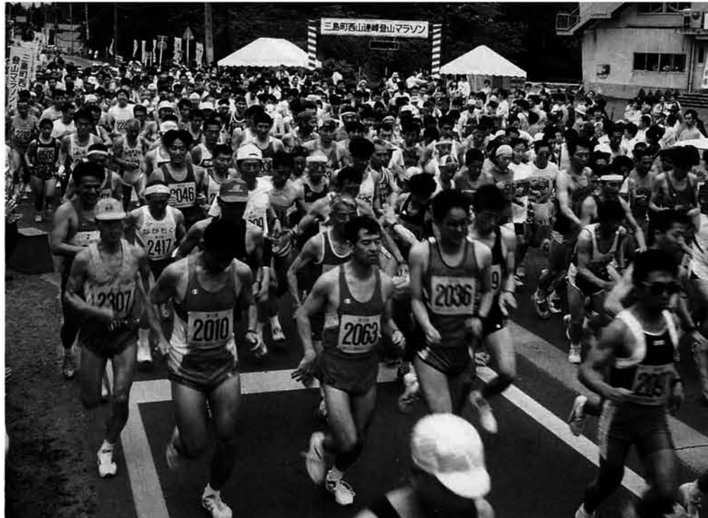
号砲一発、一斉にスタート