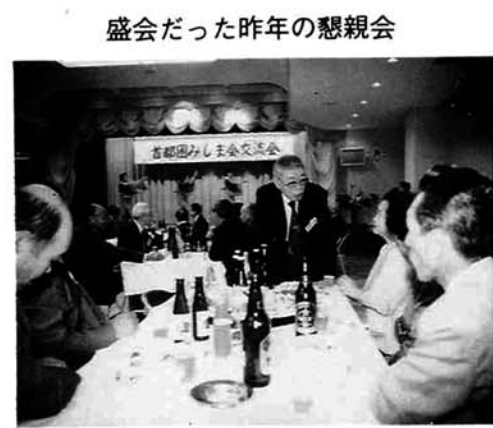
盛会だった昨年の懇親会