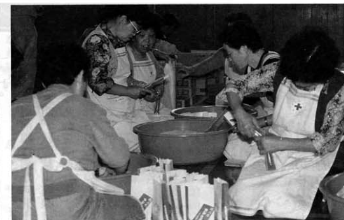
心をこめて土産を作る