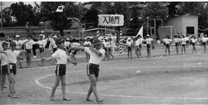
運動会で三島音頭を踊る日吉小の子どもたち