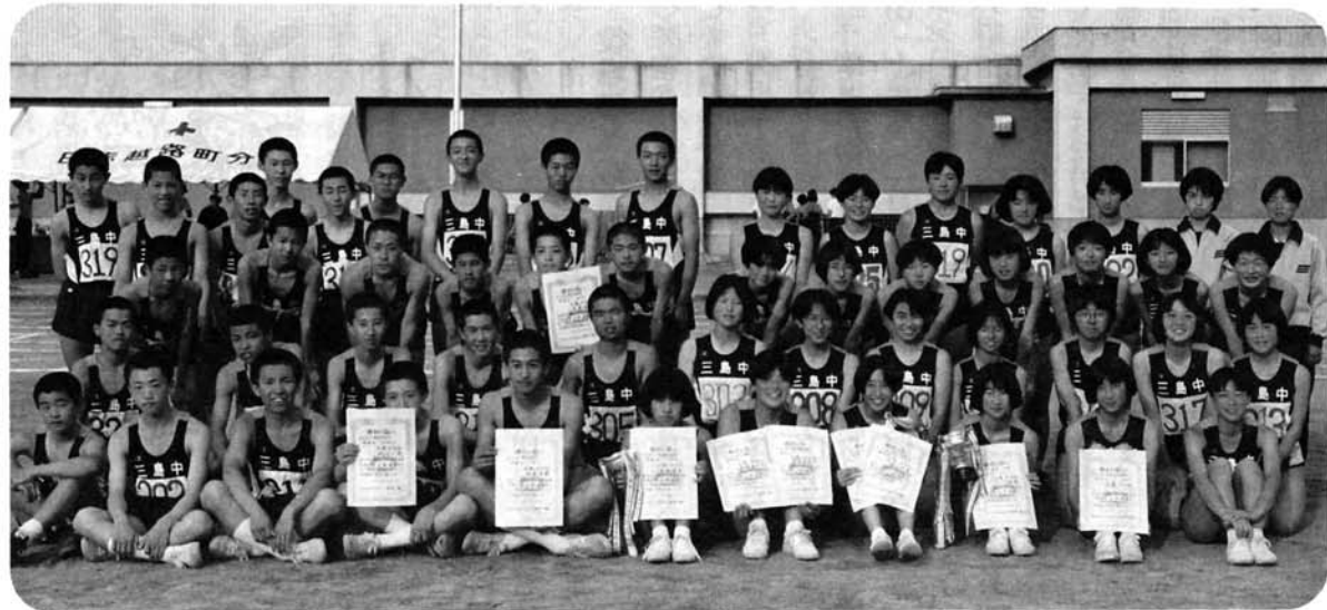
〈おそろいのユニフォームを身につけ大活躍した「三中特設陸上部」の面々〉