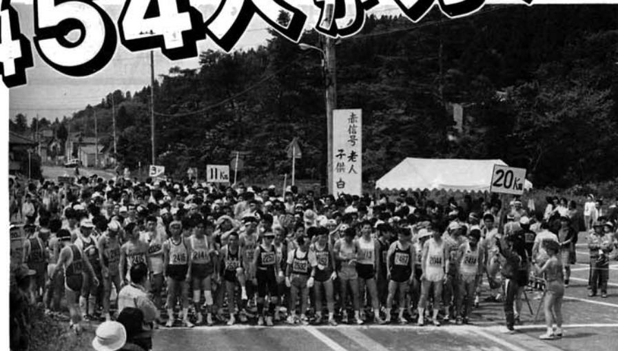
▲ スタート直前の緊張の一瞬