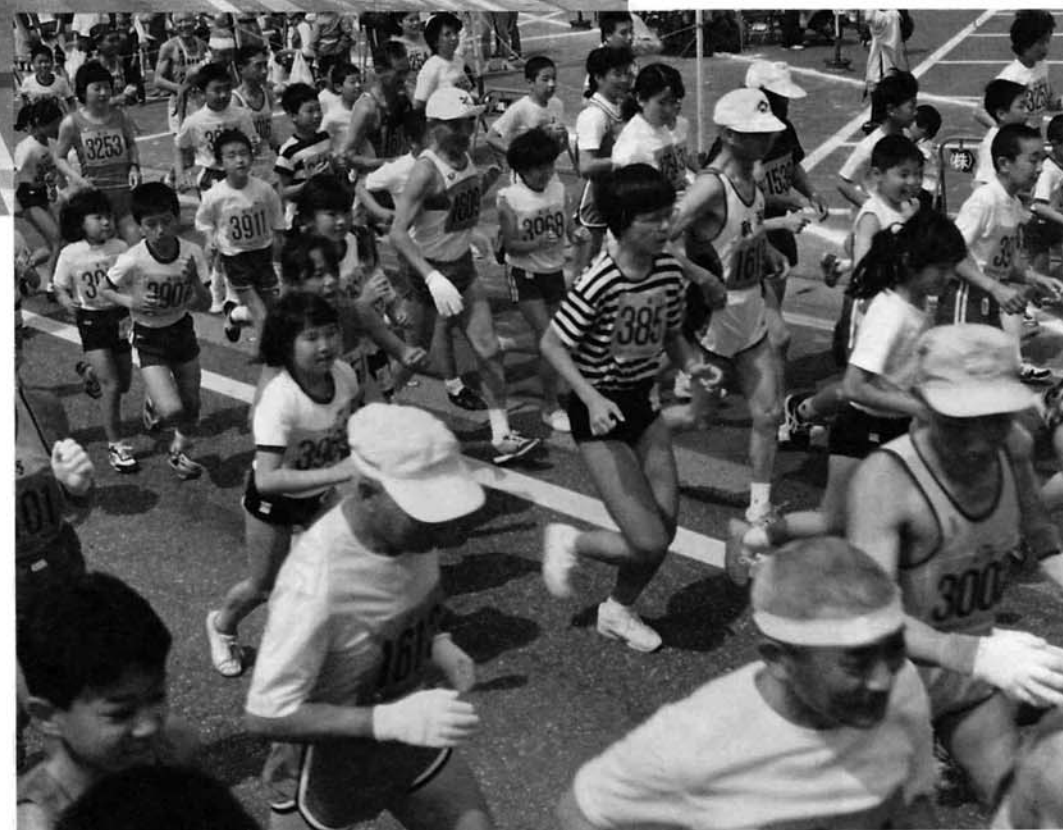
▶ 60名の小学生が参加しました。

四五四人の健脚自慢が参加した「第七回西山連峰登山マラソン大会」。三島、十一島、二十島のコースを各ランナー思い思いのペースで走りまわった。選手を励ます横断幕や立て看板と、沿道からの熱い声援で、参加ランナー全員が無事ゴール。 また、今年は文化協会のご協力で「三島首頭」「三島慕情」を始めとする民謡をアトラクションとして披露したところ、選手からは「走り終えた後の疲れも忘れ、本当に楽しかった」「他のマラソン大会にはない企画でおもしろい」といった声が聞かれ、好評でした。