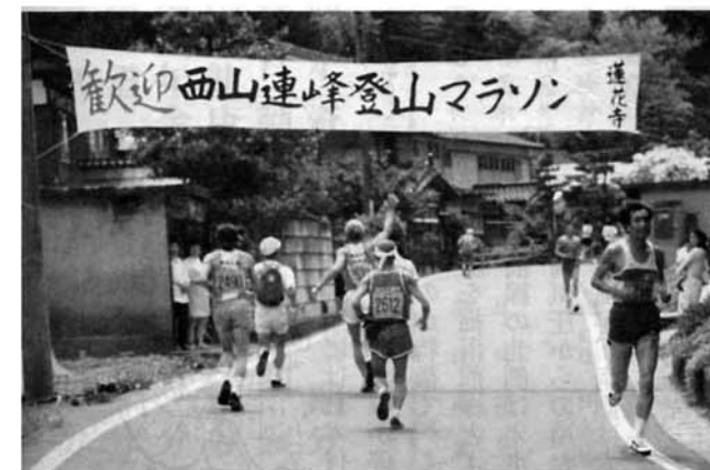
ランナーを元気づけた横断幕

四五四人の健脚自慢が参加した「第七回西山連峰登山マラソン大会」。三島、十一島、二十島のコースを各ランナー思い思いのペースで走りまわった。選手を励ます横断幕や立て看板と、沿道からの熱い声援で、参加ランナー全員が無事ゴール。 また、今年は文化協会のご協力で「三島首頭」「三島慕情」を始めとする民謡をアトラクションとして披露したところ、選手からは「走り終えた後の疲れも忘れ、本当に楽しかった」「他のマラソン大会にはない企画でおもしろい」といった声が聞かれ、好評でした。